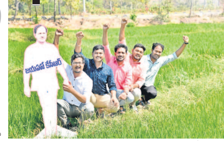
సిరిసిల్ల టౌన్: పంట పొలాల్లో జన్మదిన వేడుకలను పురస్కరించుకుని నిలువెత్తు కేసీఆర్ కటౌట్తో నంబురాలు చేసుకుంటున్న బీఆర్ఎస్ వీ నాయకులు

తెలంగాణ సాధకుడు, తొలి సీఎం కేసీఆర్ బర్త్ డే వేడుకలంబరాన్నంటింది. ఉరూవాడా పండుగచేసుకున్న, కరీంనగర్ ఉమ్మడి జిల్లా వ్యాప్తంగా జిల్లా వ్యాప్తంగా జిల్లా వ్యాప్తంగా ప్రజలు, ప్రజాప్రతినిధులు ఆలయాలలో ప్రత్యేక పూజలు చేయడంతోపాటు కేసులు కేసీసీ, మిరాయిలు పంచారు. దవాఖానాలు, ఆశ్రమాల్లో పండ్లు పంపిణీ చేయడంతోపాటు పలుచోట్ల అన్నదానాలు చేయగా, పలువురు వినుకొండగా నిర్వహించి తమ అభిమానాన్ని చాటుకున్నారు. సాగును సులభం చేయడానికి ఆయురారోగ్యాలతో ఉండాలని, శతమానం భవతి అంటూ కాంక్షించారు.