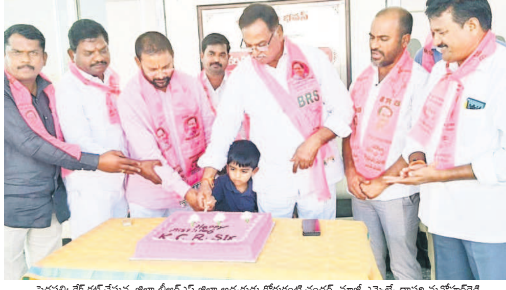
పెద్దపల్లి: కేక్ కట్ చేస్తున్న జిల్లా బీఆర్ఎస్ జిల్లా అధ్యక్షుడు కోరుకంటి చందర్, మాజీ ఎమ్మెల్యే దాసరి మనోహర్ రెడ్డి