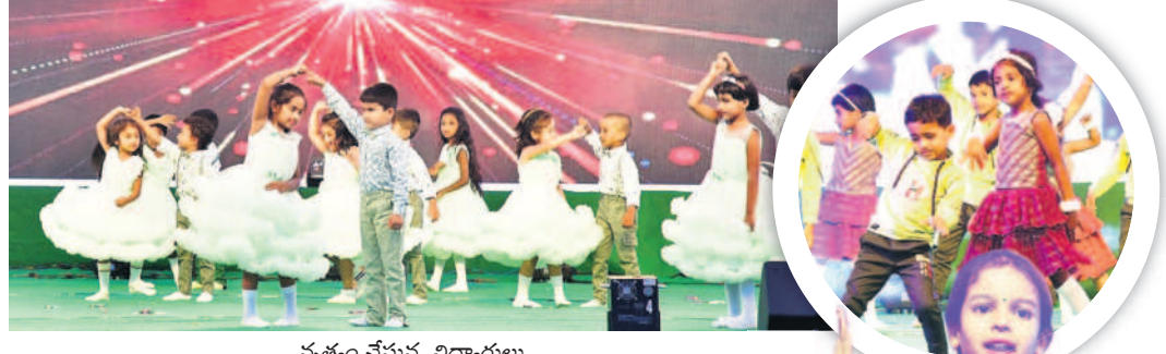
నత్తం చేస్తున్న విద్యార్థులు