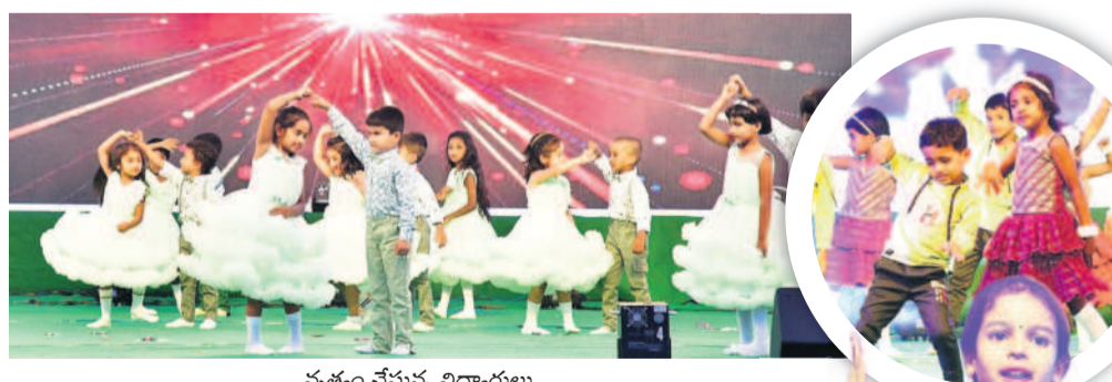
నృత్యం చేస్తున్న విద్యార్థులు