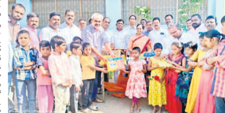
రామడుగ(హొప్పదండి): వెలిచాలలోని ప్రకాంత్ భవన్లో విద్యార్థులకు నిత్యావసర వస్తువులను పంపిణీ చేస్తున్న బీఆర్ఎస్ రాష్ట్ర నాయకుడు వీర వెంకటేశ్వరరావు