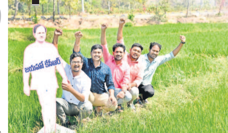
సిరిసిల్ల టౌన్: పండు పాల్లో జన్మదిన వేడుకలను పురస్కరించుకుని నిలువెత్తు కేసీఆర్ కటౌట్తో నంబూరాలు చేసుకుంటున్న బీఆర్ఎస్ ని నాయకులు

తెలంగాణ సాధకుడు, తొలి సీఎం కేసీఆర్ బర్త్ డే వేడుకలంబరాన్నంటింది. ఉరూవాదా పండుగచేసుకున్న, కరీంనగర్ ఉమ్మడి జిల్లా వ్యాప్తంగా జిల్లా వినోద శ్రేణులు, ప్రజాప్రతినిధులు ఆలయాలలో ప్రత్యేక పూజలు చేయడంతోపాటు కేకులు కోసే, మిఠాయిలు పంచారు. దవాఖానాలు, ఆశ్రమాల్లో పండ్లు పంపిణీ చేయడంతోపాటు పలుచోట్ల అన్నదానాలు చేయగా, పలువురు విసనాత్కంగా నిర్వహించి తమ అభిమానాన్ని చాటుకున్నారు. సాంఘిక సంఘాలతో కలిసి ఆయురారోగ్యాలతో ఉండాలని, శతమానం భవతి అంటూ కాంక్షించారు.