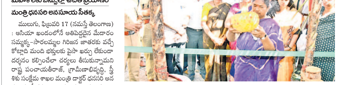
తాత్కాలిక అడ్డంకి బస్సులను ప్రారంభిస్తున్న మంత్రి సీతక్క

అధికారులు భక్తులతో మర్యాదగా వ్యవహరించాలి మహిళలకు బస్సుల్లో ఉచిత ప్రయాణం మంత్రి ధనసరి అనంతూరి సీతక్క