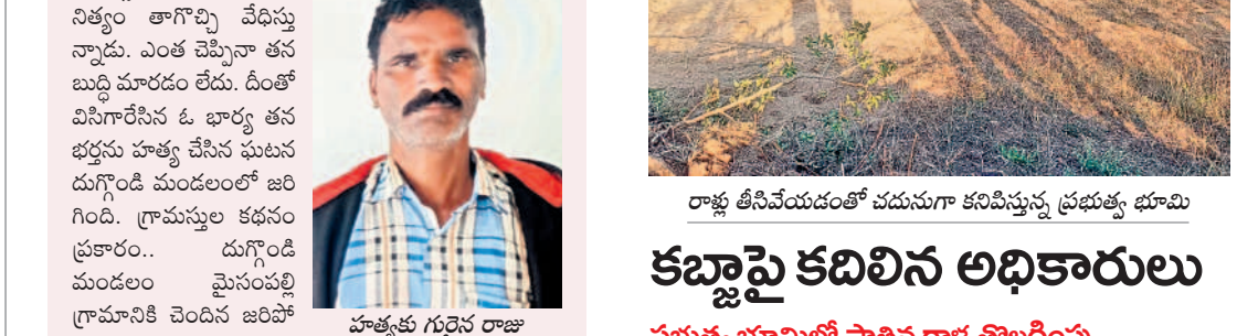
హత్యకు గురైన రాజు

• మద్యానికి బానిసై పెద్దన్నండంతో హత్య • పోలీస్ స్టేషన్ లో లొంగుబాటు