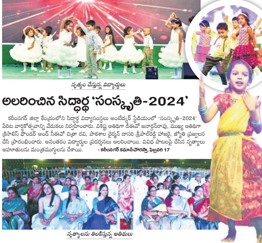
సత్కారాలను తిలకిస్తున్న అతిథులు