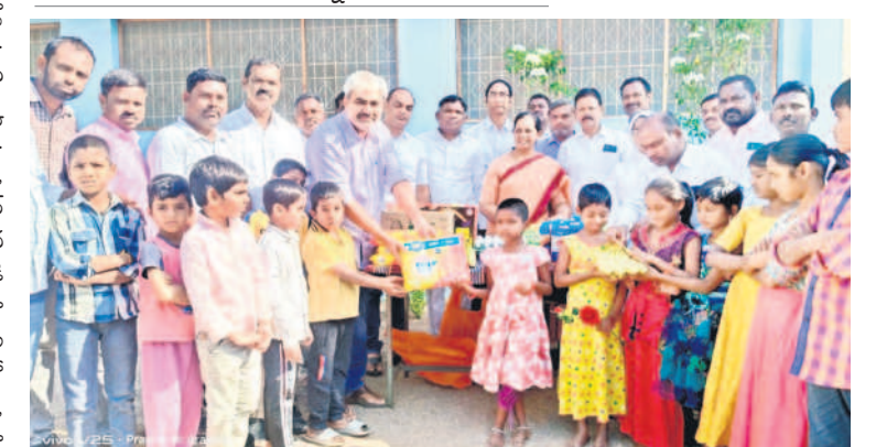
రామడుగ(చొప్పదండి): వెలిచాలలోని ప్రకాశ్ భవన్లో విద్యార్థులకు నిత్యావసర వస్తువులను పంపిణీ చేస్తున్న బీఆర్ఎస్ రాష్ట్ర నాయకుడు వీర వెంకటేశ్వరరావు