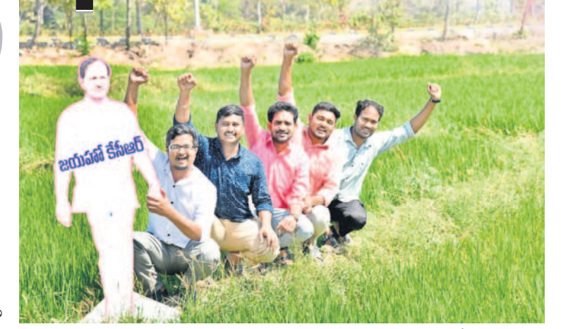
సిరిసిల్ల టౌన్: పంట పొలాల్లో జన్మదిన వేడుకలను పురస్కరించుకుని నిలువెత్తు కేసీఆర్ కటౌట్తో నంబూరాలు చేసుకుంటున్న బీఆర్ఎస్ వీని నాయకులు

తెలంగాణ సాధకుడు, తొలి సీఎం కేసీఆర్ బర్త్ డే వేడుకల అంబరాన్నంటింది. ఉరూవాదా పండుగచేసుకున్న, కరీంనగర్ ఉమ్మడి జిల్లా వ్యాప్తంగా జివీఆర్ఎస్ శ్రేణులు, ప్రజాప్రతినిధులు ఆలయాల్లో ప్రత్యేక పూజలు చేయడంతోపాటు కేకులు కోసే, మిఠాయిలు పంచారు. దవాఖానాలు, ఆశ్రమాల్లో పండ్లు పంపిణీ చేయడంతోపాటు పలుచోట్ల అన్నదానాలు చేయగా, పలువురు విసనాత్కంగా నిర్వహించి తమ అభిమానాన్ని చాటుకున్నారు. సాంఘిక సంక్షోభం అయిపోవడానికి కారణమని, శతమానం భవతి అంటూ కాంక్షించారు.