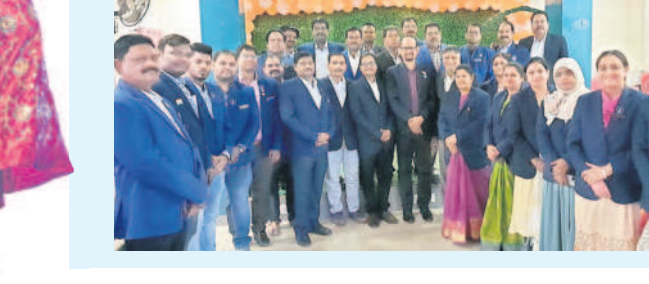
సమావేశమైన పబ్లిక్ ప్రాసిక్యూటర్లు