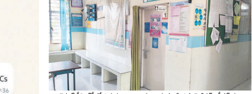
జైపూర్ పీహెచ్సీలో ఉదయం 10.10 గంటలకు మూసీ ఉన్న మెడికల్ ఆఫీసర్ గది

మని ఒకరోజుకు చెప్పోవడం కనిపించింది. రోజూ డాక్టర్ కంటే ముందు వచ్చేవాళ్ళం.. ఈ రోజు లేదాగా వచ్చినట్లుయ్యండంటూ అసలు విషయం చెప్పుకోవచ్చు.