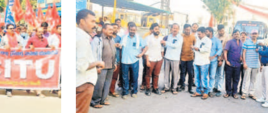
మంచిర్యాల అర్బన్ : రాస్తారోకో చేస్తున్న కార్మికులు, రైతులు, వ్యవసాయ కార్మికుల సంఘం నాయకులు

రించాలని జీఎం బస్సెర్దికి విసతిపత్రం అందించారు. మండమరెడ్డి పట్టణంలో వివిధ కార్మిక సంఘాల నాయకులు నిరసనలు తెలిపారు. విజిట్ యూసీ ఆధ్వర్యంలో స్థానిక అంబేద్కర్ విగ్రహం ఎదుట కోల్పోల్ రహదారిపై రాస్తారోకో చేశారు. సీబీటీయూఎ ఆధ్వర్యంలో సింగరేణి కాంట్లాక్ కార్మికులు జీఎం కార్యాలయం ఎదుట, ఏరియా స్టోర్, చర్మిపాపం ఎదుట నిరసన ప్రదర్శన నిర్వహించారు. తాండూర్ లోని బీపీఎం ఓసీ-2 వద్ద ఐఎన్టీయూసీ బెల్లంపల్లి పట్టణంలోని బజార్ ఏరియా కాంటా చౌరస్తా వరకు సీబీటీయూఎ ఆధ్వర్యంలో రాళ్ల తీసి నిర్వహించారు. జైపూర్ లో ఎన్టీయూసీ కాంట్లాక్ కార్మికులు సమస్యలు పరిష్కరించాలని జీఎం బస్సెర్దికి విసతిపత్రం అందించారు. మండమరెడ్డి పట్టణంలో వివిధ కార్మిక సంఘాల నాయకులు నిరసనలు తెలిపారు. విజిట్ యూసీ ఆధ్వర్యంలో స్థానిక అంబేద్కర్ విగ్రహం ఎదుట కోల్పోల్ రహదారిపై రాస్తారోకో చేశారు. సీబీటీయూఎ ఆధ్వర్యంలో సింగరేణి కాంట్లాక్ కార్మికులు జీఎం కార్యాలయం ఎదుట, ఏరియా స్టోర్, చర్మిపాపం ఎదుట నిరసన ప్రదర్శన నిర్వహించారు. తాండూర్ లోని బీపీఎం ఓసీ-2 వద్ద ఐఎన్టీయూసీ బెల్లంపల్లి పట్టణంలోని బజార్ ఏరియా కాంటా చౌరస్తా వరకు సీబీటీయూఎ ఆధ్వర్యంలో రాళ్ల తీసి నిర్వహించారు. జైపూర్ లో ఎన్టీయూసీ కాంట్లాక్ కార్మికులు సమస్యలు పరిష్కరించాలని జీఎం బస్సెర్దికి విసతిపత్రం అందించారు.