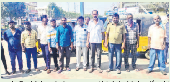
చెన్నైలో : సమస్యలు పరిష్కరించాలని నిరసన వ్యక్తం చేస్తున్న ఆటో డ్రైవర్లు