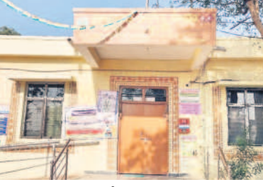
తాండూర్ లో 9 గంటలకు దాటినా తెరకూసిన పీహెచ్సీ