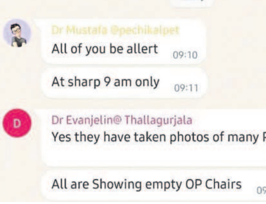
నమస్తే తెలంగాణ విజిట్ ఉదయం వాట్సాప్ గ్రూప్ లో డాక్టర్ బిజినెస్ మెన్స్ జే (స్ట్రీట్ పాల్)