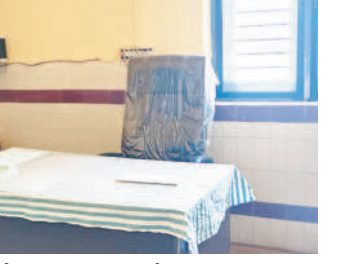
భీమనోల్ 10 గంటలకు ఖాళీగా కనిపిస్తున్న వైద్యాధికారి కుర్చీ