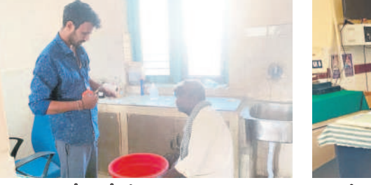
నెస్సెల పీహెచ్సీలో సమయానికి సిబ్బంది రాకపోవడంతో డిఎంహెచ్ఎస్ చేస్తున్న వార్డు బాయ్

కేసీఆర్ ప్రభుత్వంలో వైద్యాధికారులు, సిబ్బంది సమయపాలన కచ్చితంగా పాటించాలనే ఉద్దేశంతో అప్పటి కల్తెకల్ భారతీ హాజిరీ తెలిపే బయోమెట్రిక్, యూపీహెచ్సీలు, సీహెచ్సీలు, బస్టి దవాఖానాలు, పల్లె దవాఖానాల్లో