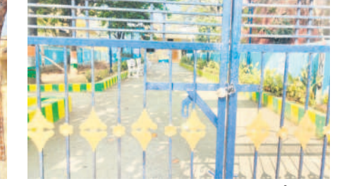
ఉదయం 9.51 గంటలకు కూడా తెరకూసిన మంచిర్యాల హుటాహుటిన బస్టి దవాఖాన