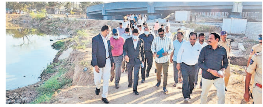
చెరువు స్థలాన్ని పరిశీలించిన హైకోర్టు అధ్యక్షుడి కమిషన్ సభ్యులు