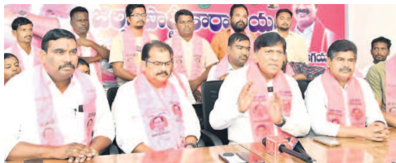
మాట్లాడుతున్న మాజీ ఎంపీ వినోద్ కుమార్