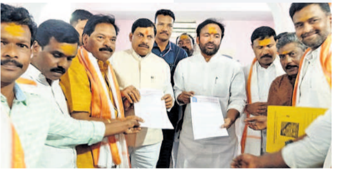
మధ్యప్రదేశ్ సీఎం మోహన్ యాదవ్, కేంద్ర మంత్రి కిషన్ రెడ్డికి వివరాలు తెలిపిన ఇన్స్పెక్టర్ చైర్మన్

రూ. 100 కోట్లు కేటాయింపుల వివరాలు కొమురవెల్లి మల్లికార్జున స్వామి క్షేత్రాభివృద్ధికి కేంద్ర ప్రభుత్వం నుంచి రూ. 100 కోట్ల నిధులు మంజూరు చేయాలని కోరుతూ కేంద్ర మంత్రి కిషన్ రెడ్డి, మధ్యప్రదేశ్ సీఎం మోహన్ యాదవ్ కలిసి కేంద్ర మంత్రి కిషన్ రెడ్డిని కలవ చేశారు. పాన్సం లోని పరిశ్రమలకు వాడలో ఆక్సిజన్ తనిఖీలు చేయాలని కోచారు. పాన్సం లోని పరిశ్రమలకు వాడలో ఆక్సిజన్ తనిఖీలు చేయాలని కోచారు. పాన్సం లోని పరిశ్రమలకు వాడలో ఆక్సిజన్ తనిఖీలు చేయాలని కోచారు.