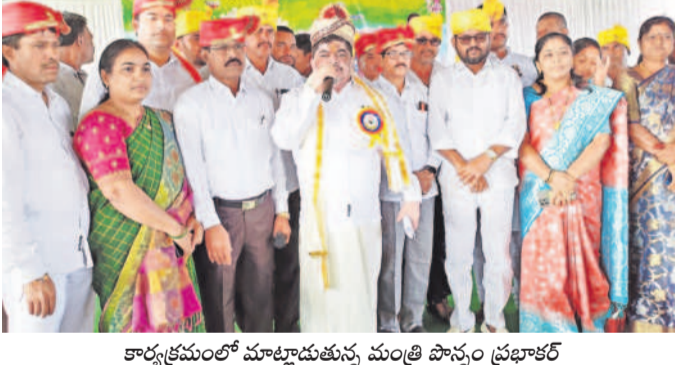
కార్యక్రమంలో మాట్లాడుతున్న మంత్రి పాన్సం ప్రభాకర్