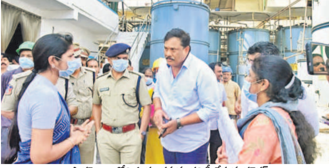
పాన్సం లోని ఓ పరిశ్రమను తనిఖీ చేస్తున్న కలెక్టర్

పైనే సీట్ల విషయంలో రాజీనామా లేదు ● కాలిక్యూని నియంత్రించాలి ● సంగారెడ్డి కలెక్టర్ వల్లంకొండ ● పాన్సం లోని పరిశ్రమలకు వాడలో ఆక్సిజన్ తనిఖీలు పటాన్చెరు, ఫిబ్రవరి 15: సంగారెడ్డి కలెక్టర్ వల్లంకొండ పరిశ్రమలను ఆక్సిజన్ తనిఖీ చేసే హాదస్థితులను, వరుస తనిఖీలతో పాన్సం లోని పరిశ్రమలకు వాడలో ఆక్సిజన్ తనిఖీలు చేయాలని కోచారు. పాన్సం లోని పరిశ్రమలకు వాడలో ఆక్సిజన్ తనిఖీలు చేయాలని కోచారు. పాన్సం లోని పరిశ్రమలకు వాడలో ఆక్సిజన్ తనిఖీలు చేయాలని కోచారు.