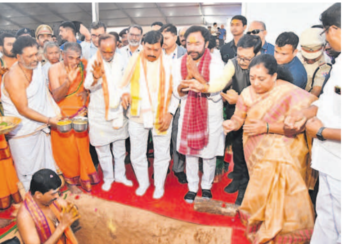
భూమిపూజ చేస్తున్న మధ్యప్రదేశ్ సీఎం మోహన్ యాదవ్, కేంద్ర మంత్రి కిషన్ రెడ్డి

పైనే సీట్ల విషయంలో రాజీనామా లేదు ● కాలిక్యూని నియంత్రించాలి ● సంగారెడ్డి కలెక్టర్ వల్లంకొండ ● పాన్సం లోని పరిశ్రమలకు వాడలో ఆక్సిజన్ తనిఖీలు పటాన్చెరు, ఫిబ్రవరి 15: సంగారెడ్డి కలెక్టర్ వల్లంకొండ పరిశ్రమలను ఆక్సిజన్ తనిఖీ చేసే హాదస్థితులను, వరుస తనిఖీలతో పాన్సం లోని పరిశ్రమలకు వాడలో ఆక్సిజన్ తనిఖీలు చేయాలని కోచారు. పాన్సం లోని పరిశ్రమలకు వాడలో ఆక్సిజన్ తనిఖీలు చేయాలని కోచారు. పాన్సం లోని పరిశ్రమలకు వాడలో ఆక్సిజన్ తనిఖీలు చేయాలని కోచారు.