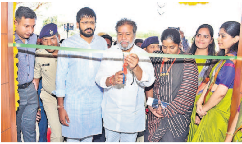
మెడకల్ భరోసా కేంద్రాన్ని ప్రారంభిస్తున్న మంత్రి దామోదర రాజనంద్రంపా, చిత్రంలో కలెక్టర్ రాజేష్ షా, ఎమ్మెల్యే రోహిణీరావు