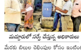
మద్యులలో సర్వే చేస్తున్న అధికారులు