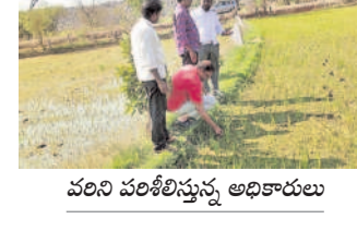
వరిని పరిశీలిస్తున్న అధికారులు