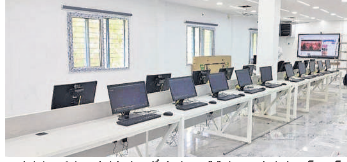
ప్రభుత్వ బాలికల ఉన్నత పాఠశాలలో ప్రారంభానికి సిద్దంగా ఉన్న కంప్యూటర్ ల్యాబ్