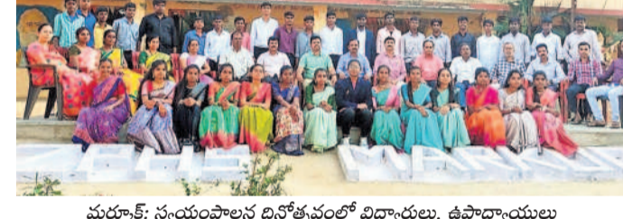
మర్యాద: స్వయంపాలన దినోత్సవంలో విద్యార్థులు, ఉపాధ్యాయులు