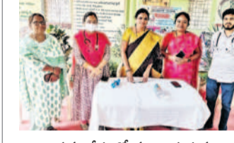
సమావేశంలో మాట్లాడుతున్న ఎంపీటీ వ్యవసాయ, వైద్యాధికారి

దుబ్బాక, ఫిబ్రవరి 15 : గ్రామీణ ప్రజలకు మెరుగైన వైద్య సేవలందించాలని వైద్య