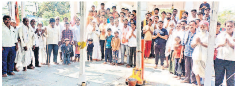
రాజీవ్ గర్ తండాలో ప్రత్యేక పూజలు నిర్వహిస్తున్న గిరిజనులు