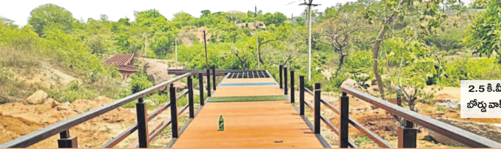
2.5 కి.మీ బోర్డు వాక్