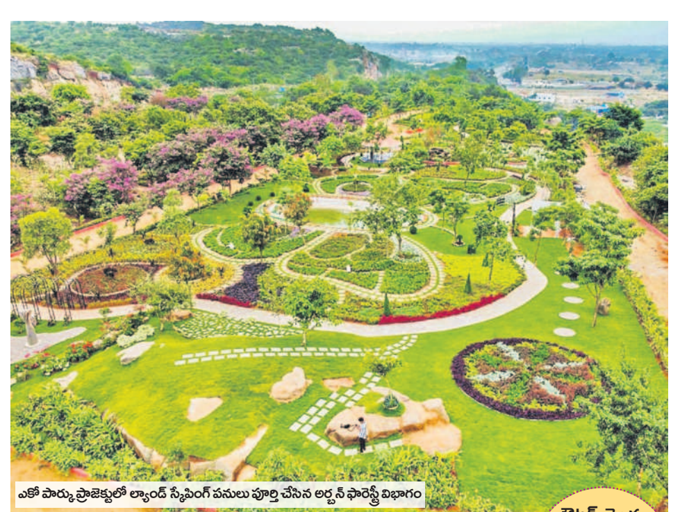
ఎకో పార్కు ప్రాజెక్టులో ల్యాండ్ సేషింగ్ పనులు పూర్తి చేసిన అర్జన్ ఫార్మేషన్ విభాగం