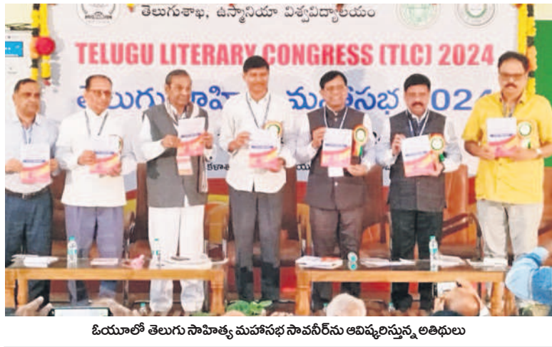
ఓయూలో తెలుగు సాహిత్య మహాసభ సావనీర్ ను ఆవిష్కరిస్తున్న అతిథులు