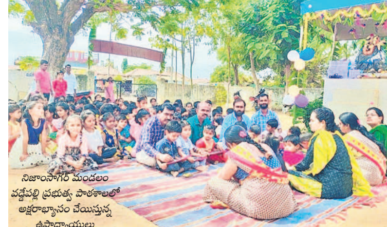
నిజామాబాద్ మండలం వద్దేపల్లి ప్రభుత్వ పాఠశాలలో అక్షరాభ్యాసం చేయిస్తున్న ఉపాధ్యాయులు