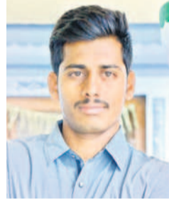
బెల్లంకొండ కార్మికుల (39) ఆదివారం దుర్ఘటి ముగించుకొని బెల్లంకొండ కార్మికులకు తెలిపారు.