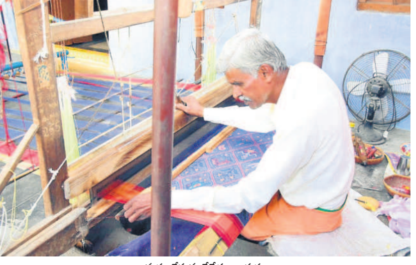
మగ్గం నేస్తున్న చేనేత కార్మికుడు

యాదాద్రి భువనగిరి, ఫిబ్రవరి 14 (నమస్తే తెలంగాణ) : కొత్తగా అధికారంలోకి వచ్చిన కాంగ్రెస్ ప్రభుత్వం సంక్షేమ పథకాలకు ఒక్కొక్కటిగా పాతర వేస్తున్నది. ఇటీవల వరకు సమర్పవంతంగా అమలైన కార్యక్రమాలను ఆపివేస్తున్నది. చేనేత కార్మికుల కోసం బీఆర్ఎస్ ప్రభుత్వం తీసుకొచ్చిన చేనేత మిత్ర పథకానికి మంగళం పాడే ప్రయత్నాలు చేస్తున్నది. నేతన్నలకు నెలకు రూ.3వేల ఆర్థిక సాయాన్ని అందించకుండా అటకెక్కిస్తున్నది. దీనిపై చేనేత కార్మికులు, సంఘాల నాయకులు ఆగ్రహం వ్యక్తం చేస్తున్నారు. ఉమ్మడి రాష్ట్రంలో నేతన్నల బతుకులు అప్రస్థానంగా ఉండేవి. సర్కారు తోడ్పాటు లేక వారి కుటుంబ పరిస్థితులు దుర్భరంగా మారి జీవితం వెల్లడియడమే కష్టంగా ఉండేది. పనిలేక, ఉపాధి కరువు అప్పుల పాలయ్యారు. తెచ్చిన అప్పులు, మిశ్రీలు కట్టలేక ఆత్మహత్యలకు పాల్పడిన ఘటనలు ఎన్నో ఉన్నాయి కానీ.. స్వరాష్ట్రంలో నేతన్నల బతుకులు మారాయి. నాటి బీఆర్ఎస్ ప్రభుత్వం అనేక సంక్షేమ కార్యక్రమాల తీసుకొచ్చింది. నేతన్నలకు పావుపు పథకం, బెండ్లస్థ, రాయి తీలు, పాపం పడ్డీ రుణ మాఫీ, ఆదుకు ఆసుయంత్రాల పథకం, నేతన్నకు తీమా పథకాలను అమలు చేసింది.