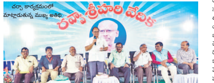
పల్నాడు కార్యక్రమంలో మాట్లాడుతున్న ముఖ్య అతిథి

బాలసాహిత్యానికి డిమాండ్: హైదరాబాద్ బుక్ ఫెయిర్ లో బాల సాహిత్యానికి సంబంధించిన పుస్తకాలు ఎక్కువగా అమ్ముతున్నాయని స్టాల్ నిర్వాహకులు తెలిపారు. చిట్టి చిట్టి పల్నాడు కార్యక్రమంలో మాట్లాడుతున్న ముఖ్య అతిథి