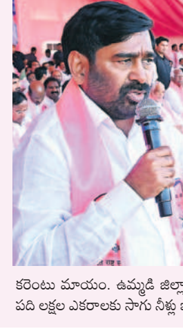
కరెంటు మాయం. ఉమ్మడి జిల్లాకు కేసీఆర్ పది లక్షల ఎకరాలకు సాగు నీళ్లు ఇస్తే వాటిని

కేసీఆర్ నల్లగొండకు వచ్చి ఏం చేశాడనే వెదకవలసి సమస్యగా ఉంది. మీరు పెంచి పోషించిపోయిన కరువును ప్రజలకు దూరం చేశారు. ఆకలి వాపులను దూరం చేశారు. యాభి ఏంపై పెంచి పోషించి రెండు స్త్రుల లక్షల మందిని బలి తీసుకున్న షాన్లలోని సిన ఆరెండ్రోనే దూరం చేశారు. తెలంగాణ వచ్చే నాటికి ఉమ్మడి జిల్లాలో మూడు లక్షల టన్నుల ధాన్యం పంపడమే మహా గగనం. బీఆర్ఎస్ పాలనలో నాలుగేండ్లలోనే నల్లగొండ లక్షల టన్నుల ధాన్యం పంపడమే మహా గగనం. ఇవన్నీ కనిపించిన చెత్త నాయకులు మాట్లాడుతున్నారు. కాంగ్రెస్ పాలన వచ్చిన రోజుకే జరిగిన మాచ్చోటుబడి 24 గంటల