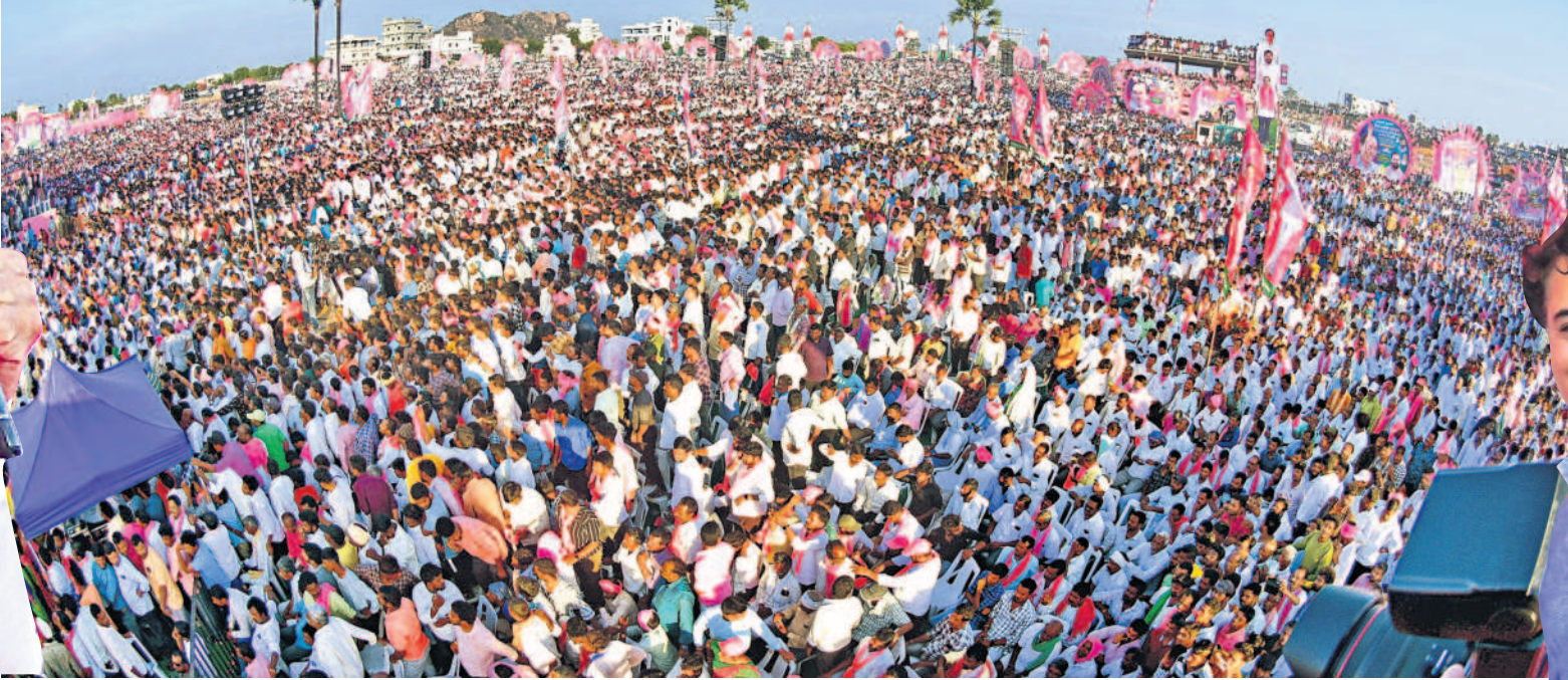
నల్లగొండలో బహిరంగ సభకు పెద్ద ఎత్తున హాజరైన జనం