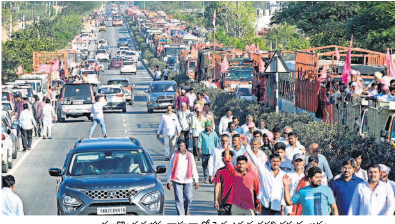
నల్లగొండ సభకు వాహనాల్లో పెద్ద ఎత్తున తరలి వచ్చిన జనం