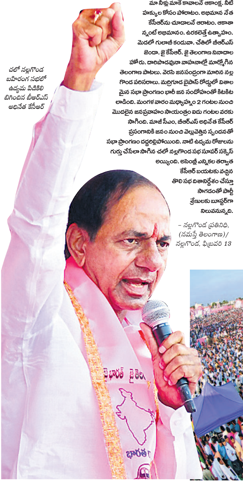
చలో నల్లగొండ బహిరంగ సభలో ఉద్యమ వీడియో దిగించిన బీఆర్ఎస్ అధినేత కేసీఆర్

మా నీళ్లు మాకే కావాలనే ఆకాంక్ష, నీటి హక్కుల కోసం పోరాటం. అభిమాన నేత కేసీఆర్ను చూడాలనే ఆరాటం. ఆకాశా న్నంటే అభిమానం. ఉరకలెత్తే ఉత్సాహం. మెడలో గులాబీ కండువా. చేతిలో బీఆర్ఎస్ జెండా. జై కేసీఆర్. జై తెలంగాణ నినాదాల పోరు. ధారితాదాపునా వాచానాలో మాట్లాడిన తెలంగాణ పాటలు. వెరసె జనసంద్రంగా మారిన నల్ల గొండ పరిసరాలు. మల్లగూడ వైచిత్రి రోడ్డులో విశాల ఘన సభా ప్రాంగణం భారీ జన సందోహంతో తీకితీట లాడింది. మంగళ వారం మధ్యాహ్నం 2 గంటల నుంచి మొదలైన జనప్రవాహం సాయంత్రం 10 గంటల వరకు సాగింది. మాజీ సీఎం, బీఆర్ఎస్ అధినేత కేసీఆర్ ప్రసంగానికి జనం నుంచి వెల్లువెత్తిన స్పందనతో సభా ప్రాంగణం దద్దరిల్లిపోయింది. నాటి ఉద్యమ రోజులను గుర్తు చేసేలా సాగిన చలో నల్లగొండ సభ సూపర్ సక్సెస్ అయ్యింది. అసెంబ్లీ ఎన్నికల తర్వాత కేసీఆర్ బయటకు వచ్చిన తొలి సభ దశాబ్దంలోనే చేస్తూ సాగడంతో పార్టీ శ్రేణులకు బూస్టర్గా నిలువనున్నది.