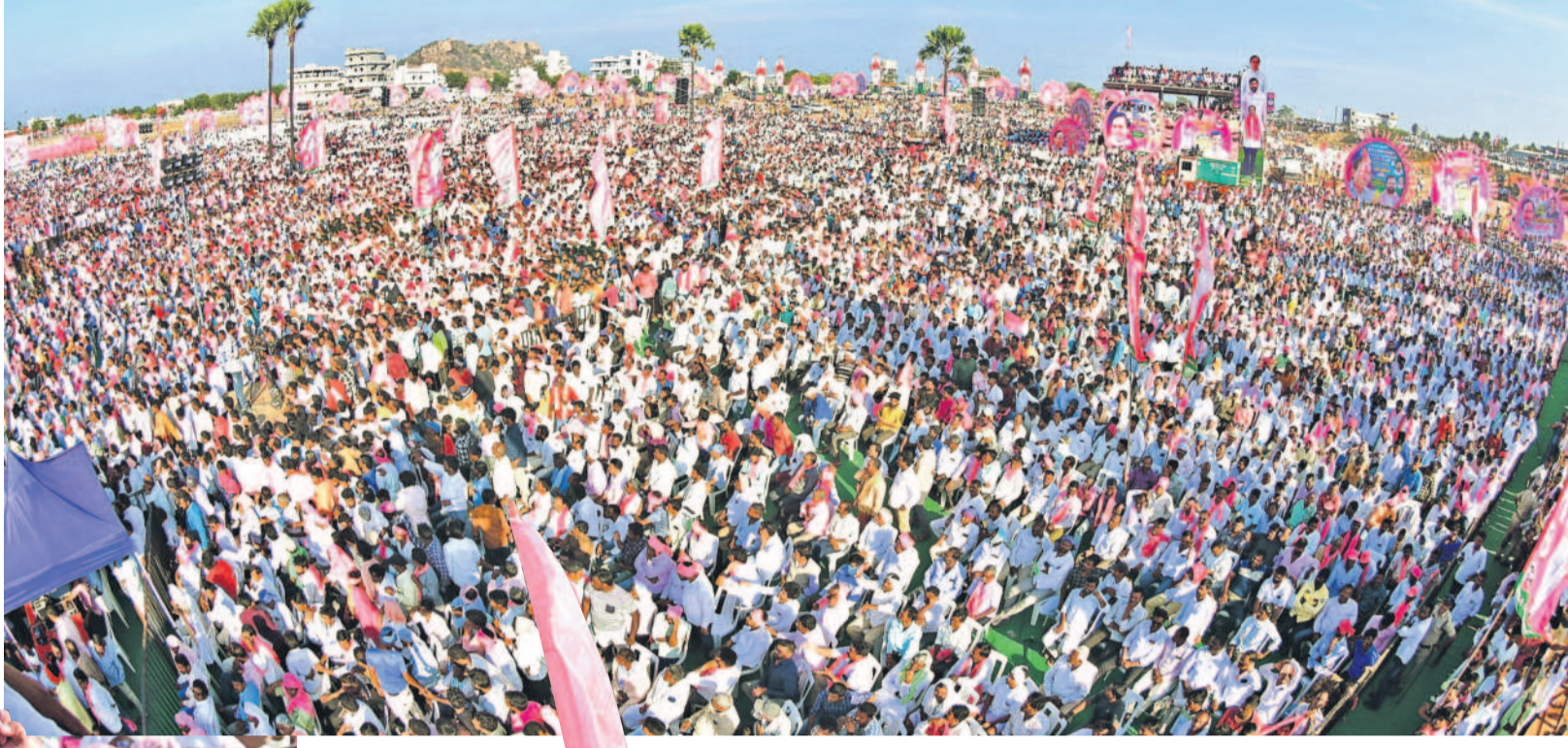
నల్లగొండ సమీపంలోని మల్లగూడలో జరిగిన 'చలో నల్లగొండ' సభకు అనేకంగా హాజరైన బీఆర్ఎస్ కార్యకర్తలు, ప్రజలు