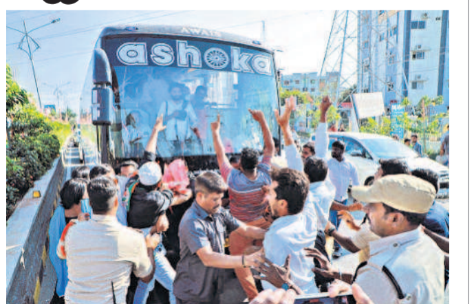
చలో నల్లగొండ బహిరంగ సభకు మాజీ మంత్రులు కేటీఆర్, హరిశ్చంద్రావు, వెన్నెమల బస్సును నల్లగొండ పట్టణంలో అడ్డుకుంటున్న ఎన్ఎస్యూఆర్ కార్యకర్తలు

నల్లగొండ ప్రతినది, ఫిబ్రవరి 13 (నమస్తే తెలంగాణ): చలో నల్లగొండ సభకు అడుగుడుగునా అటంకాలు సృష్టించేందుకు మంత్రి కోమటిరెడ్డి వెంకటరెడ్డి చేసిన ప్రయత్నాలు, కుయుక్తులు వివరాలు య్యాయి. సభకు బీఆర్ఎస్ అధినేత కేసీఆర్ తీరును వివరించే వెంటనే నల్లగొండలో తిరగనివ్వడం.. అడ్డుకుంటామని ప్రకటన చేశారు. ఆ వెంటనే జిల్లాలో 30, 30(ఎ) సెక్షన్లు అమలు చేస్తున్నట్లు పోలీస్ శాఖ ప్రకటించింది. దాంతో సభ నిర్వహణకు అనుమతి కోరుతూ బీఆర్ఎస్ నేతలు లెఖ అందజేస్తే రెండు రోజుల సుదీర్ఘ సమాలో చనిల తర్వాత పలు షరతులతో కూడిన అనుమతి ఇస్తున్నట్లు వెల్లడించింది. మరోవైపు సోమవారం కేసీఆర్ నల్లగొండకు వస్తున్న సందర్భంగా కాంగ్రెస్ కార్యకర్తలు నిరసనల పేరుతో హైదరాబాద్ నుండి వచ్చి మంత్రి కోమటిరెడ్డి ఆడికాలలో ఆ పార్టీకి చెందిన కొంతమంది కార్యకర్తలు కొట్ల వరకు, ప్రతి సందర్భంలో కృష్ణా పరీవాహక ప్రాంతాల్లో ఉన్న ఐదు జిల్లాల ప్రజలు ఎప్పుడీ కప్పకు పోరాటానికి సిద్ధంగా ఉండాలి.