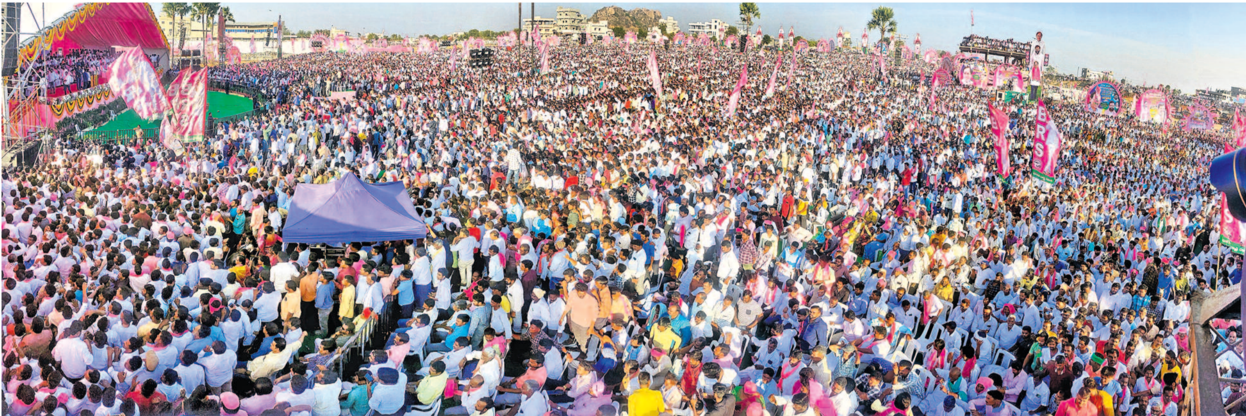
నల్లగొండ శివారు చర్యలలో మంగళవారం బీఆర్ఎస్ పార్టీ అధ్యక్షులతో నిర్వహించిన చలో నల్లగొండ బహిరంగ సభకు అశేషంగా తరలివచ్చిన ప్రజలు, పార్టీ శ్రేణులు