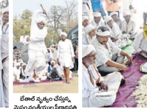
సతీదేవత వద్ద భక్తులు వేసిన పాత్రాలను కిలోలవారిగా పంపిణీ