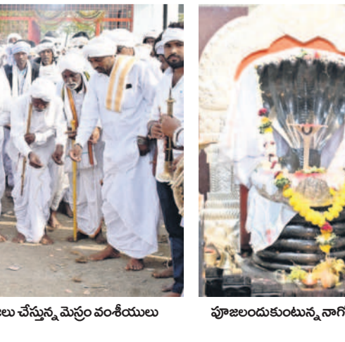
పూజలందుకుంటున్న నాగోబా విగ్రహం