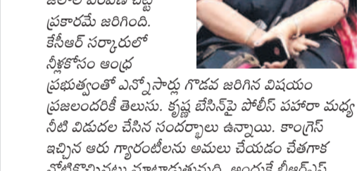
కేసీఆర్, ఎమ్మెల్యే, ఆసిఫాబాద్.

ఆసిఫాబాద్, ఫిబ్రవరి 13 : కాంగ్రెస్ పార్టీ ఆసెంట్లీ సూక్ష్మ కృష్ణా జలాల పంపిణీ విషయంపై అబద్ధాలు చెబుతూ ప్రజలను పక్కదోవ పట్టేస్తున్నది. కృష్ణా జలాల పంపిణీ వట్టి ప్రకారమే జరిగింది. కేసీఆర్ నర్సాపూర్లో నీళ్లకోసం అంద్ర ప్రభుత్వంతో ఎన్నోసార్లు గొడవ జరిగిన విషయం ప్రజలందరికీ తెలుసు. కృష్ణ జలాలపై పోలీస్ పహారా మద్దతి వీధులలో చేసిన సందర్భాలు ఉన్నాయి. కాంగ్రెస్ ఇచ్చిన ఆరు గ్యారంటీలను అమలు చేయడం చేతగాక నోటికొచ్చినట్లు మాట్లాడుతున్నది. అందుకే బీఆర్ఎస్ అధినేత నీళ్లకోసం మరో ఉద్యమానికి శ్రీకారం చుట్టారు.