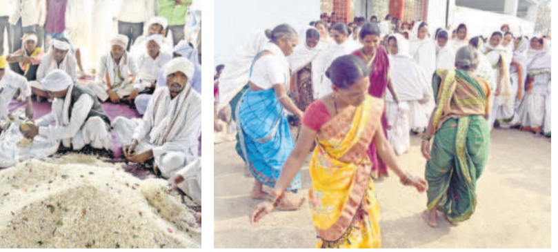
సంప్రదాయ నృత్యాలు చేస్తున్న మహిళలు