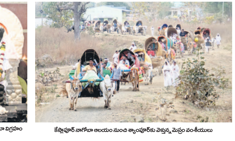
కేసీఆర్ నాగోబా ఆలయం నుంచి శ్యాంపూర్ కు వెళ్తున్న మెర్రం వంశీయులు