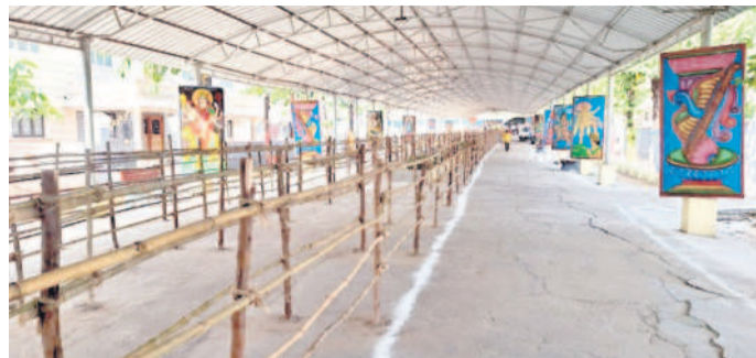
భక్తులకోసం ఏర్పాటు చేసిన క్యూలైన్లు