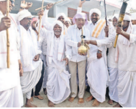
బేతారే ముగింపు పూజలు చేస్తున్న మెర్రం వంశీయులు