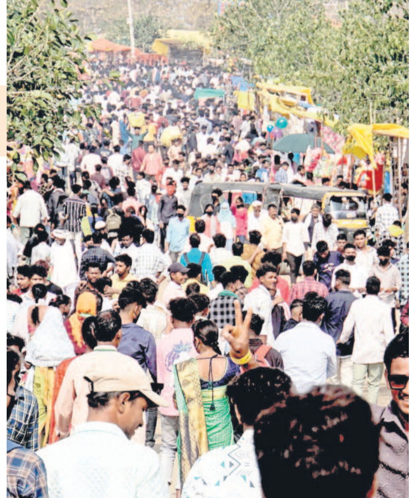
ఆదిలాబాద్ జిల్లా ఇంద్రవెల్లి మండలంలోని కేసీఆర్ నాగోబా జాతరకు తరలివస్తున్న ప్రజలు