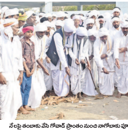
నేలపంతులకు వేసి గోవాడ్ ప్రాంతం నుంచి నాగోబాకు పూజలు చేస్తున్న మెర్రం వంశీయులు