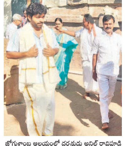
జోగుశాంబ ఆలయంలో దర్శకుడు అనిల్ రావిపూడి

అలంపూర్, ఫిబ్రవరి 12 : అన్నదాత శక్తి పీఠాల్లో ఐదో శక్తి పీఠమైన అలంపూర్ జోగుశాంబ ఆలయానికి ప్రముఖ సిని దర్శకుడు అనిల్ రావిపూడి సోమవారం దర్శించుకున్నారు. జోగుశాంబ వారిక ప్రత్యేకంగా వినోదం చేసే సినీ అయినకు దేవస్థానం వారు ఆలయ మర్యాదలతో స్వాగతం పలికారు. ఈ సందర్భంగా ఆయన స్వామివారికి అభిషేకం, అమ్మవారికి కుంకుమార్చనతోపాటు ప్రత్యేక పూజలు నిర్వహించి మొక్కులు చెల్లించుకున్నారు. ఆ సంతకం అర్చకులు ఆయనకు తీర్ధప్రసాదాలు అందించి ఆశీర్వచనం పలికారు. కార్యక్రమంలో ఆలయ ధర్మకర్తలు, అర్చకులు ఉన్నారు.