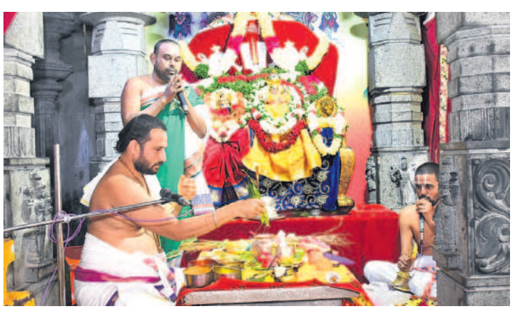
నిత్య కల్యాణం నిర్వహిస్తున్న అధ్యక్షులు