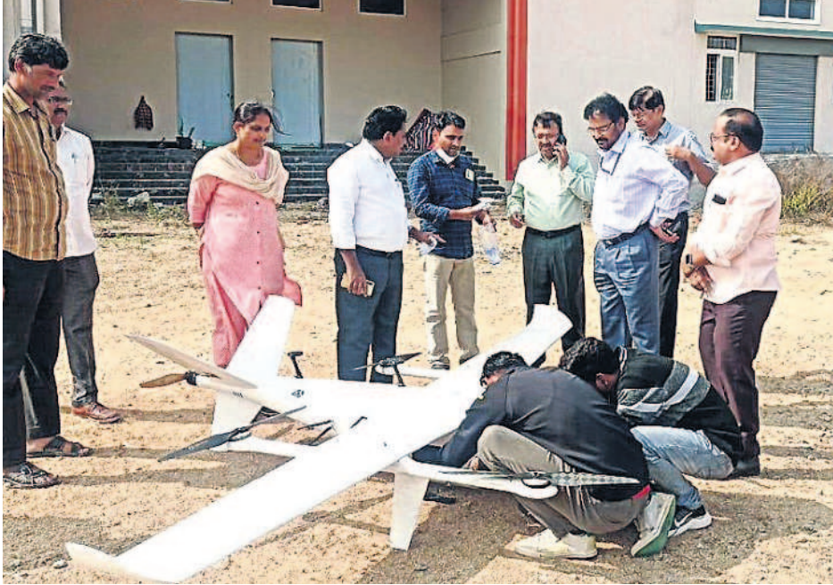
డ్రోన్ ద్వారా మెడిసిన్, డయాగ్నోస్టిక్స్ శాంపిల్స్ రవాణాకు సిద్ధం చేస్తున్న సిబ్బంది

- యాదాద్రి భువనగిరి, ఫిబ్రవరి 11 (నమస్తే తెలంగాణ) / బీబీనగర్