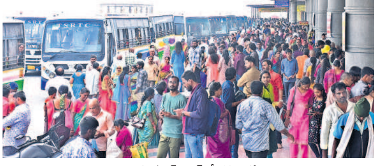
కొండపైన బస్ స్టాండ్ లో భక్తుల రద్దీ