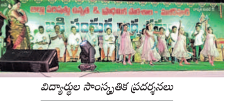
విద్యార్థుల సాంస్కృతిక ప్రదర్శనలు