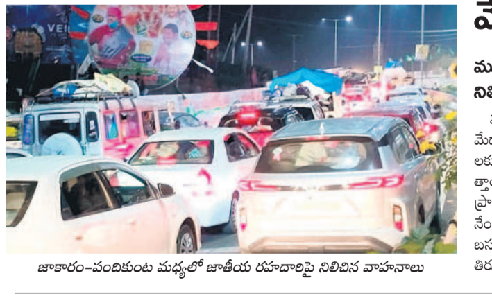
జాతరం-పంటకుంట్ల మధ్యలో జాతీయ రహదారిపై నిలిచిన వాహనాలు