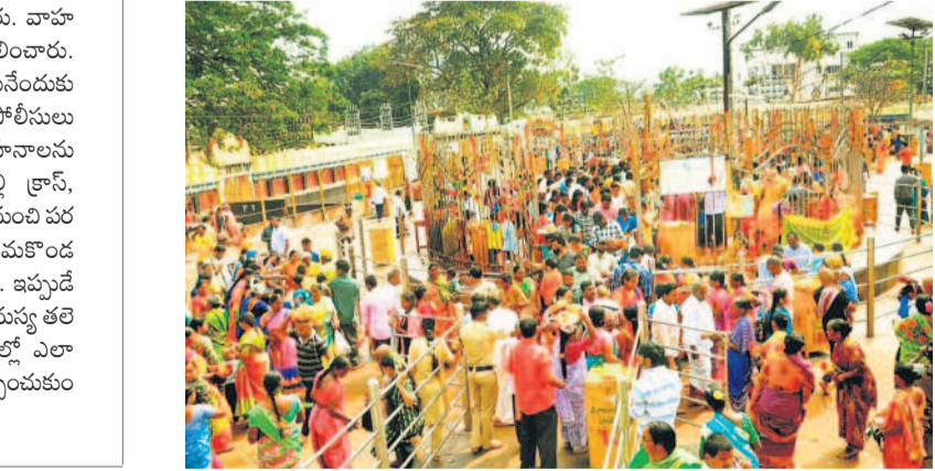
సమస్త దేవత గద్దెను దర్శించుకుంటున్న భక్తులు