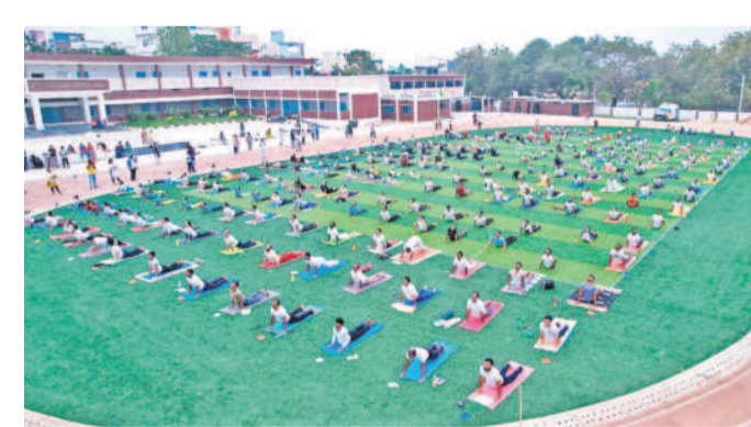
సూర్య సమస్థానాలు చేస్తున్న యోగా విద్యార్థులు