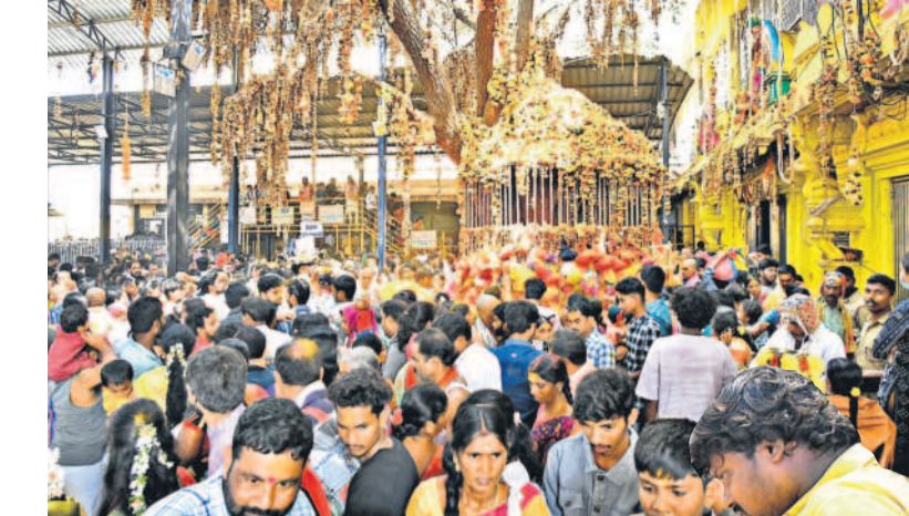
మల్లన్న ఆలయ ప్రాంగణంలోని గంగరేగు చెట్టు వద్ద భక్తుల మొక్కులు