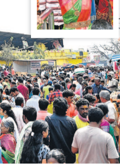
కొమురవెల్లి మల్లికార్జున స్వామి ఆలయ రాజగోపురం వద్ద భక్తుల రద్దీ