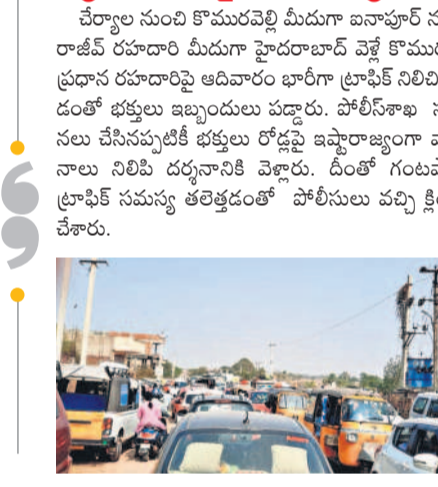
ఆలయ ప్రధాన వీధిలో భక్తుల రద్దీ