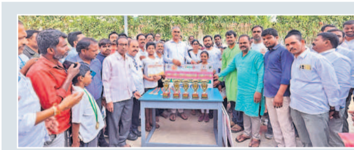
సిద్దిపేటలో విజేతలకు బహుమతులు అందజేస్తున్న ఎమ్మెల్యే హారీశ్ రావు

దుయతో ఉమా యాత్రను సంతోషంగా ముగించుకొని రావాలన్నారు. పేదల ఉమా యాత్రకు వెళ్తున్న వారిని సన్నానిస్తున్న ఎమ్మెల్యే హారీశ్ రావు విమర్శించారు. బీఆర్ఎస్ హయాంలో హైదరాబాద్ తర్వాత సిద్దిపేటలోనే హాజీహా నీల్ ఉమా యాత్రకు వెళ్తున్న పది మంది యువకులను ఆయన సన్మానించారు. ఈ సందర్భంగా మాట్లాడుతూ, బడ్జెట్లో రూ.4 వేల కోట్లు ప్రవేశపెడతామని చెప్పి, రూ.2,200 కోట్లు ప్రవేశపెట్టి కాంగ్రెస్ సర్కారు మోసం చేసిందన్నారు. అల్లా