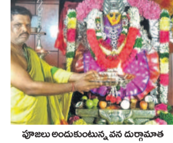
పూజలు అందుకుంటున్న వన దుర్గామాత