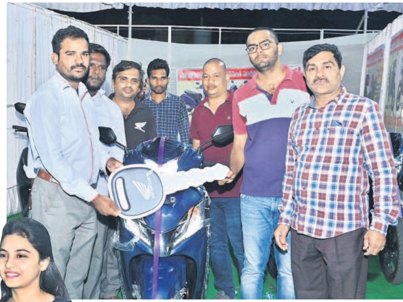
కొనుగోలుదారులకు తాళం చెవిని అందజేస్తున్న కంపెనీ ప్రతినిధులు

5 నిజామాబాద్, సోమవారం 12 ఫిబ్రవరి 2024 KAMAREDDY