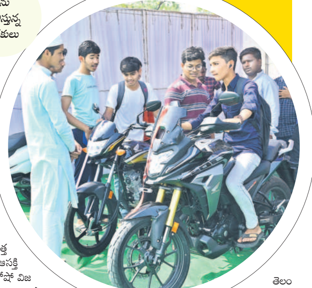
బైక్ ను పరిశీలిస్తున్న యువకులు

ఆటో షో సర్కిస్ అటో షోలో ఆర్టిఫిషియల్ ఇంటలిజెన్స్, ఇంటెలిజెన్స్, తెలంగాణ టుడే ఆధ్వర్యంలో నిర్వహించిన ఆటో షో విజయవంతమయ్యింది. నిజామాబాద్ జిల్లా కేంద్రంలోని పాత కలెక్టరేట్ మైదానంలో రెండు రోజులపాటు నిర్వహించిన వాహనాల ప్రదర్శన ఆదివారం ముగిసింది. ఆదివారం సెలవు రోజు కావడంతో సందర్శకులు పెద్ద సంఖ్యలో హాజరయ్యారు. కొందరు సర్కిస్ వాహనాలను నడిపి ఆనందించారు. నిజామాబాద్ తోపాటు హైదరాబాద్ కు చెందిన వివిధ కంపెనీల వాహనాలు జిల్లావాసులను ఆకట్టుకున్నాయి. నిజామాబాద్, కామారెడ్డి, నిర్మల్ జిల్లాల నుంచి వచ్చిన వాహనస్థియలు మార్కెట్లోకి కొత్తగా వచ్చిన వాహనాల వివరాలను తెలుసుకున్నారు. ఉదయం నుంచి రాత్రి వరకు సందర్శకులతో స్టాఫ్ కిటికీలాడావారు. ఏవీ, ఎల్ క్లీక్ వాహనాలపై ఆసక్తి.