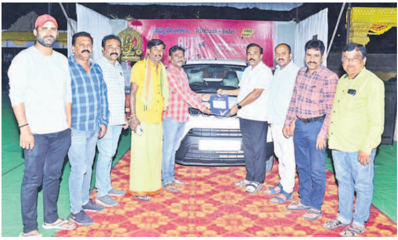
కొనుగోలుదారులకు కారు తాళం చెవిని అందజేస్తున్న నమస్తే తెలంగాణ సిబ్బంది