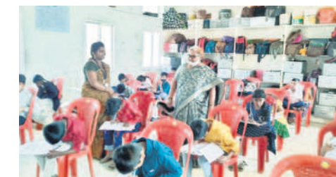
ఓ కేంద్రంలో పరీక్ష రాస్తున్న విద్యార్థులు

డివీషన్, ఫిబ్రవరి 11 : తెలంగాణ సాంఘిక సంక్షేమ, గిరిజన సంక్షేమ, మహాత్మా జ్యోతిరావు పూర్తి వెనుకబడిన తరగతుల సంక్షేమం గురుకులాల, టీవీఆర్ఎస్ పాఠశాలల్లో (2024-25) 5వ తరగతిలో ప్రవేశానికి ఆదివారం పరీక్ష నిర్వహించినట్లు గిరిజనల్ కె-ఆర్ఎస్ అలివేలు తెలిపారు. నిజామాబాద్ రీజియన్లో 44 కేంద్రాల్లో పరీక్ష నిర్వహించినట్లు పేర్కొన్నారు. నిజామాబాద్ జిల్లాలో 17, కామారెడ్డిలో 11, నిర్మల్లో 16 పరీక్షా కేంద్రాలు ఏర్పాటు చేసినట్లు తెలిపారు. ప్రవేశ పరీక్షకు నిజామాబాద్ జిల్లాలో మొత్తం 5881 మంది పరీక్షకు దరఖాస్తు చేసుకోగా, 5559 మంది ఎలక్ట్రిక్ హాజరయ్యారు. కామారెడ్డి జిల్లాలో 4160 మంది విద్యార్థులకు 3895 మంది, నిర్మల్ జిల్లాలో 5650 మందికి 5885 విద్యార్థులు హాజరయ్యారు. రీజియన్ పరిధిలో హాజరు శాతం 94.57 శాతం సమాధిని తెలిపారు.