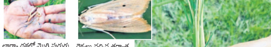
లాగూ దశలో మొగి పురుగు రెక్కలు వచ్చిన తర్వాత..

యాసంగి వరిలో మొగి పురుగు ఉధృతంగా వ్యాపిస్తున్నది. ముఖ్యంగా దీనివల్ల వరి సాగు పంటలపై ప్రభావం చూపుతున్నది మరియు పక్కా జంకీ లోపం, సర్జిక్ దుష్ప్రభావం కూడా కనిపిస్తున్నది. గత యాసంగి, వాసకాలం సీజన్లోనూ ఇలాంటి ప్రభావం పడి దిగుబడులు తగ్గాయి.. ఈ సారి అలాంటి పరిస్థితి కనిపిస్తున్నదిని రైతులు ఆందోళన చెందుతున్నారు. ఇప్పటికే అప్రమత్తమైన వ్యవసాయ శాఖ అధికారులు, శాస్త్రవేత్తలు, క్షేత్రస్థాయిలో పర్యటిస్తూ.. అన్నదాతలను అప్రమత్తం చేస్తున్నారు. నివారణ చర్యలపై అవగాహన కల్పిస్తున్నారు.