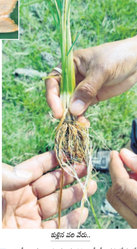
కుక్కన వరి వేరు..

యాసంగి వరిలో మొగి పురుగు ఉధృతంగా వ్యాపిస్తున్నది. ముఖ్యంగా దీనివల్ల వరి సాగు పంటలపై ప్రభావం చూపుతున్నది మరియు పక్కా జంకీ లోపం, సర్జిక్ దుష్ప్రభావం కూడా కనిపిస్తున్నది. గత యాసంగి, వాసకాలం సీజన్లోనూ ఇలాంటి ప్రభావం పడి దిగుబడులు తగ్గాయి.. ఈ సారి అలాంటి పరిస్థితి కనిపిస్తున్నదిని రైతులు ఆందోళన చెందుతున్నారు. ఇప్పటికే అప్రమత్తమైన వ్యవసాయ శాఖ అధికారులు, శాస్త్రవేత్తలు, క్షేత్రస్థాయిలో పర్యటిస్తూ.. అన్నదాతలను అప్రమత్తం చేస్తున్నారు. నివారణ చర్యలపై అవగాహన కల్పిస్తున్నారు.