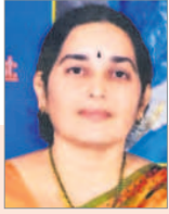
నెల్లుల్ల రమాదేవి రచయిత్రి