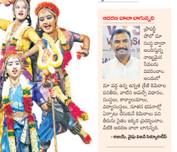
అదరణ చాలా బాగున్నది