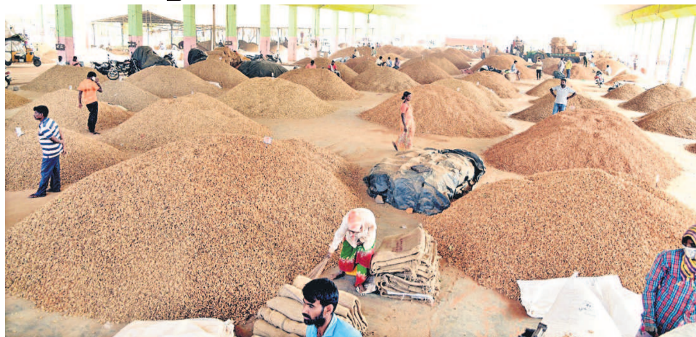
మామిడిపాటి నగర్ జిల్లా జడ్చర్లలోని బాదేపల్లి వ్యవసాయ మార్కెట్ శనివారం ఇలా పల్లి పంటతో నిండిపోయింది. రైతులు భారీగా పల్లికాయలను విక్రయించడానికి తీసుకొచ్చారు. దీంతో మార్కెట్ యార్డు పంట ఉత్పత్తులతో నిండగా కనిపించింది.