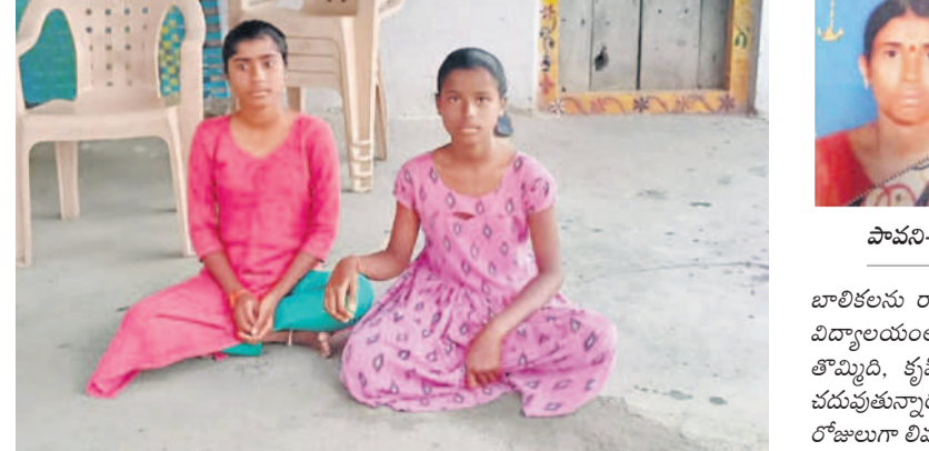
కరీంనగర్ జిల్లా రామడుగు మండలం వెంకట్రావుపల్లిలోని ఇంటి వద్ద పావని - చరశరాములు కూర్చున్న ఆడకర్మి, కృషిత్

రామడుగు (కొవ్వండం) ఫిబ్రవరి 10: అప్పుడప్పుడే ఊహ తెలుస్తున్న వయసులో అమ్మ తన్నుమూసింది. తల్లిలేని ఆడపిల్లలకు అమ్మ తన్ను తప్పిపోయింది. తల్లిలేని ఆడపిల్లలకు అమ్మ తన్ను తప్పిపోయింది. తల్లిలేని ఆడపిల్లలకు అమ్మ తన్ను తప్పిపోయింది. తల్లిలేని ఆడపిల్లలకు అమ్మ తన్ను తప్పిపోయింది.