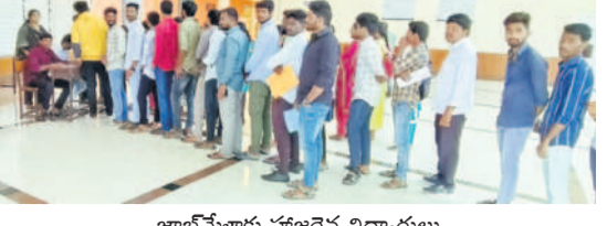
జాబ్ మేళాకు హాజరైన విద్యార్థులు