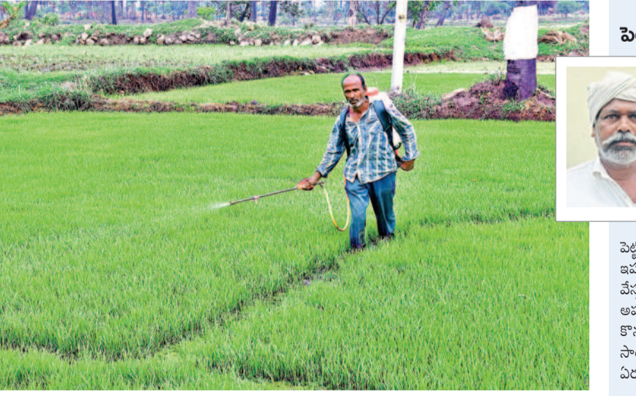
పోచంపల్లిలో పొలంలో పురుగు మందు విడిచి పోతున్న రైతు

- యాదాద్రి భువనగిరి, ఫిబ్రవరి 9 (నమస్తే తెలంగాణ)