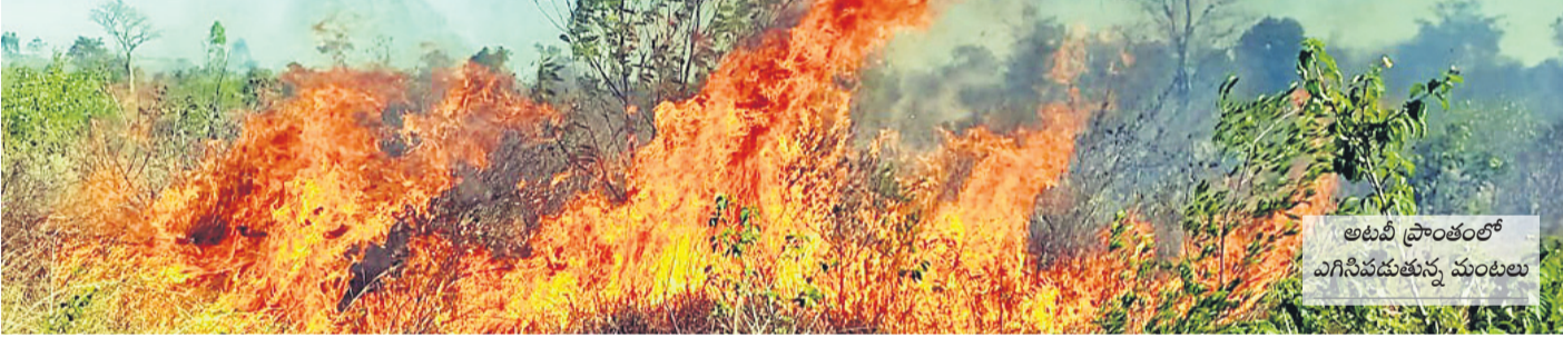
అటవీ ప్రాంతంలో ఎగిసిన పంటలు