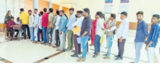
జాబ్ మేళాకు హాజరైన విద్యార్థులు