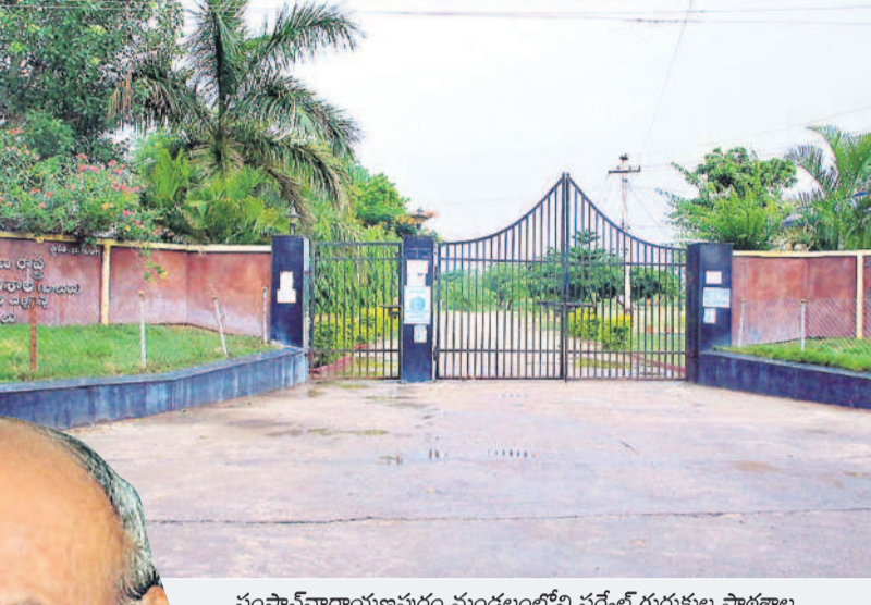
సంస్థాన నారాయణపురం మండలంలోని సర్వేలో గురుకుల పాఠశాల

పీవీ చేతుల మీదుగా సర్వేలో గురుకులు సర్వేలోని విద్యార్థులకు అయిన పీవీ సర్పంచ్ రావు విద్య అందరికీ అందాలను ఉన్నత శత్రుత్వం గురుకుల విద్యకు శ్రీకారం చుట్టారు. సంస్థాన నారాయణపురం మండలం సర్వేలో మొట్టమొదటి గురుకులాన్ని ముఖ్యమంత్రిగా ఉన్న పీవీ సర్పంచ్ రావు 1971 నవంబర్లో తన స్వయంగా ప్రారంభించారు. ఆ తర్వాత అందరినీ గురుకుల విద్యుత్పై స్పృహ వేసి అనేక గురుకులాల్లో బడుగు, బలహీనవర్గాల విద్యార్థుల ప్రతిభకు పట్టం కట్టారు. ఆ తర్వాత గురుకుల వ్యాప్తి దేశవ్యాప్తంగా పాకింది. పీవీ సర్పంచ్ రావు ఆలోచన దేశానికి ఆడర్పంగా నిలిచిందనడంలో సందేహం లేదు.