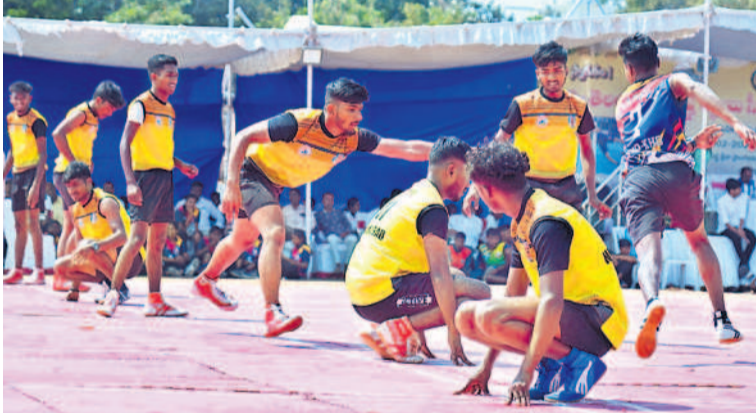
ఖోఖో ఆడుతున్న వరంగల్ నివాసులూడ జట్టు