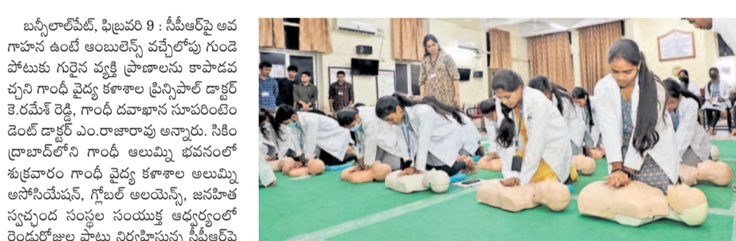
అత్యవసర సమయంలో నిర్వహించే 'సీపీఆర్' పై అవగాహన