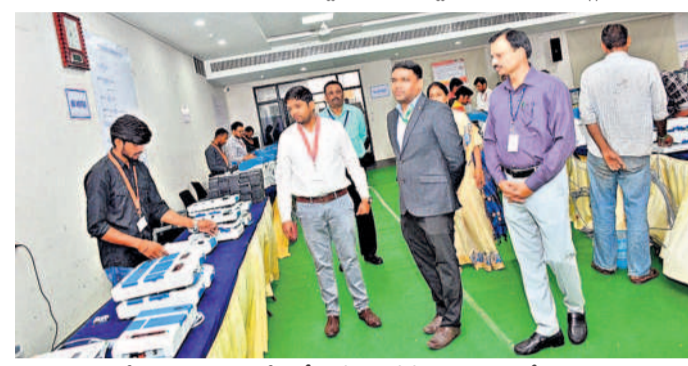
మేధుల్ జిల్లా కలెక్టరేట్లో ఈవీఎం, వీవీ ప్యాట్లను పరిశీలిస్తున్న ప్రత్యేక ఎన్కైల పరిశీలకుడు నవీన్ దుద్ది

మేధుల్, ఫిబ్రవరి 9 (నమస్తె తెలంగాణ): మేధుల్-మల్కాజిగిరి జిల్లా కలెక్టరేట్లో జరుగుతున్న ఈవీఎం, వీవీ ప్యాట్ల పనుల పరిశీలనకు రాష్ట్ర అదనపు ఎలక్ట్రీల్ అధికారి లోకేశ్ కుమార్, ఎలక్ట్రీల్ కమిషన్ ఆఫ్ ఇండియా అధికారి నవీన్ దుద్ది