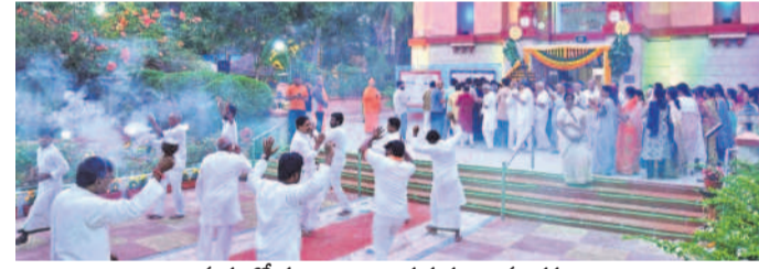
మఠంలో సంబురాలు జరుపుకుంటున్న భక్తులు