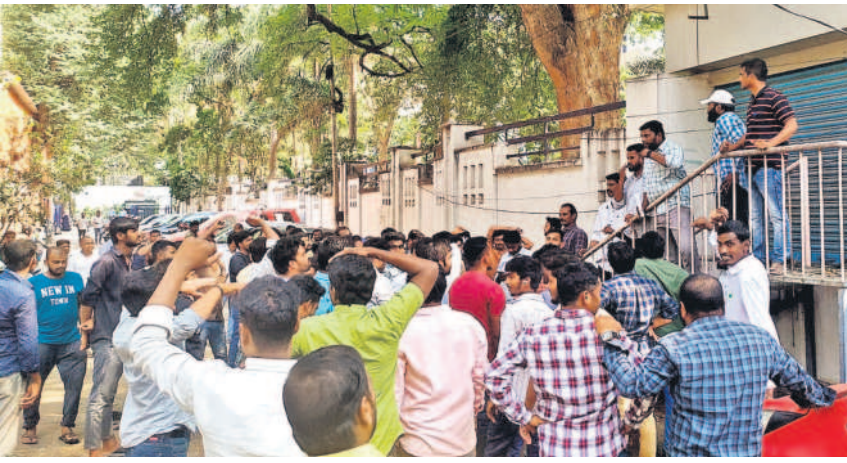
హైదరాబాద్ మిల్ రోడ్లోని టీఎన్ఎస్ఐసీఎల్ సీఎంఓని కలిసేందుకు వచ్చిన విద్యుత్ మీటర్ రిడర్లు

15 హైదరాబాద్, శనివారం 10 ఫిబ్రవరి 2024 HYDERABAD