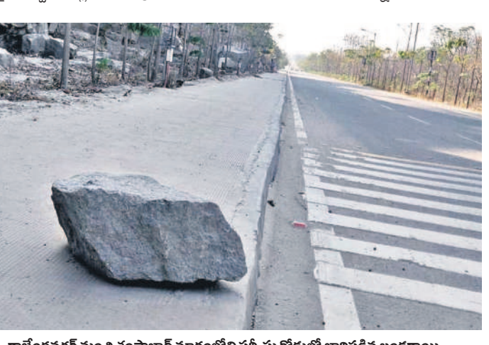
రాజేంద్రనగర్ నుంచి శంషాబాద్ మార్గంలోని సర్వీసు రోడ్డులో జారిపడిన బండరాళ్లు

సిటీబ్యూరో, ఫిబ్రవరి 9 (నమస్తే తెలంగాణ): ఓఆర్ఆర్ సర్వీస్ రహదారిపై జారిపడుతున్న బండరాళ్లు.. ప్రయాణికుల గుండెల్లో రైళ్లు పరిస్థితులు సృష్టించాయి. రింగు రోడ్డు నిర్మాణంలో భాగంగా కొన్ని చోట్ల భారీ ఎత్తులను గుట్టలను తొలగించారు. అలాంటి ప్రాంతాల్లో గుట్టల నుంచి బండరాళ్లు జారి.. సర్వీసు రోడ్డు మీదకు వస్తున్నాయి. తరచూ ఇలా జరుగుతుండటంతో టెటర్ సర్వీసు రోడ్డు మీదకు వస్తున్నాయి భయపడుతున్నారు. ముఖ్యంగా నార్సింగి నుంచి తెలంగాణ పోలీస్ అకాడమీ వరకు ఉన్న మార్గంలో మంచినీరేవు వద్ద, రాజేంద్రనగర్-హిమాచల్ నగర్ ఇంటర్వేయ్ నుంచి శంషాబాద్ వరకు ఉన్న రెండు మార్గాల్లో ఎత్తులను గుట్టల మధ్య నుంచి టెటర్ నుంచి నిర్మించారు. ఆయా ప్రాంతాల్లోని సర్వీసు రోడ్డుపై ఎప్పుడు బండరాళ్లు జారి మీద పడుతుంటేనేనే భయం వాహనదారుల్లో నెలకొన్నది. ముఖ్యంగా రాత్రి వేళల్లో కొన్ని ప్రాంతాల్లో సర్వీసు రోడ్డు మీద రాకపోకలు సాగించలేదని పరిస్థితి ఉంది. మహానగరానికి మహిళారోడ్ మాంటి బెటర్ రింగు రోడ్డుపై ఉన్న ప్రధాన రహదారి నిర్వహణ సజావుగానే ఉన్నా.. దానికి ఇరువైపులా ఉన్న సర్వీసు రహదారుల నిర్వహణను సరిగా చేపట్టడం లేదని వాహనదారులు వాపోతున్నారు. ఇదిలా ఉంటే గచ్చిబౌలి నుంచి శంషాబాద్ వరకు ఉన్న ఓఆర్ఆర్ సర్వీసు రోడ్డుపై భయం నిర్మాణ రంగానికి సంబంధించిన సామగ్రితో భారీ వాహనాలు రాకపోకలు సాగిస్తున్నాయి. వాహనాల్లోంచి మట్టి, కంకర సైతం పడుతున్నా, దాన్ని ఎప్పుడెప్పుడు తొలగించడం లేదు. అటు జారిపడుతున్న బండరాళ్లు ఒకవైపు.. మట్టి, కంకర మరోవైపు సర్వీసు రోడ్డు మీదగా ప్రయాణమంటేనే వాహనదారులు ఇంకుతున్నారు.