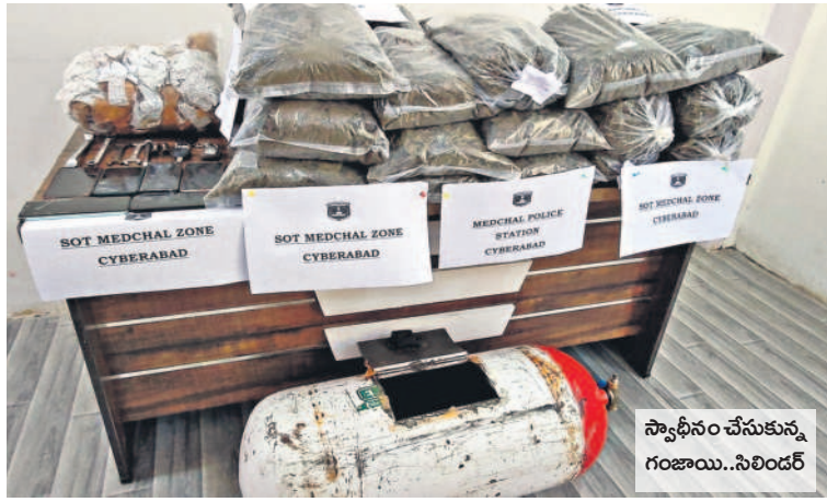
స్వాధీనం చేసుకున్న గంజాయి.. సిలిండర్

షెడ్యూల్లోనే బస్సులు ప్రయాణికుల కోసం నిలుపుతున్నాయని ఆర్టీసీ గ్రేటర్ అధికారులు స్పష్టం చేస్తున్నారు. అయితే నగరంలోని ప్రధాన ప్రాంతాల్లో ట్రాఫిక్ నియంత్రణ కోసం గుర్తించిన చోట్ల ఉన్న బస్ షెడ్యూల్లో బస్సులు నిలువవద్దని పోలీసు అధికారులు స్పష్టం చేస్తున్నారు. దీనిపై ప్రభుత్వం తని నిర్ణయం తీసుకుంటే దాని ప్రకారమే బస్ షెడ్యూల్లో బస్సులు నిలుపాలా? లేదా? అనేదానిపైనే ఆర్టీసీ యాజమాన్యం కూడా నిర్ణయం తీసుకుంటుందని చెబుతున్నారు. మొత్తానికి బస్ షెడ్యూల్లో సిటీ బస్సులు నిలువడం విషయమై పోలీసు, జీహెచ్ఎస్ఐ, ఆర్టీసీ యాజమాన్యాల మధ్య ప్రస్తుతం సమస్యయం కొరవడినట్లు తెలుస్తున్నది. కాగా, రెండు రోజుల కిందట జీహెచ్ఎస్ఐ ప్రధాన కార్యాలయంలో నగర పోలీసు విభాగంతో పాటు ఆర్టీసీ గ్రేటర్ అధికారులతో జీహెచ్ఎస్ఐ ఉన్నతాధికారులు అధ్యక్షులతో సమన్వయ సమావేశం ఏర్పాటు చేసినట్లు సమాచారం. దీనిపై మూడు ప్రభుత్వ విభాగాల్లో విభిన్న అభిప్రాయాలు వ్యక్తమైనట్లు చెబుతున్నారు. అయితే ప్రయాణికులు చూడతూ తమకు అందబాటులో బస్ షెడ్యూల్ ఏర్పాటు చేయడం వల్ల ప్రయాణం సౌకర్యవంతంగా ఉంటుందని, లేదంటే ఆలోచించి, ఇతర ప్రైవేటు వాహనాల్లో వెళ్లాల్సి వస్తుందని, ఇది తమకు తలకుమిందిన ఆర్థిక భారంగా మారుతుందని ఆవేదన వ్యక్తం చేస్తున్నారు.