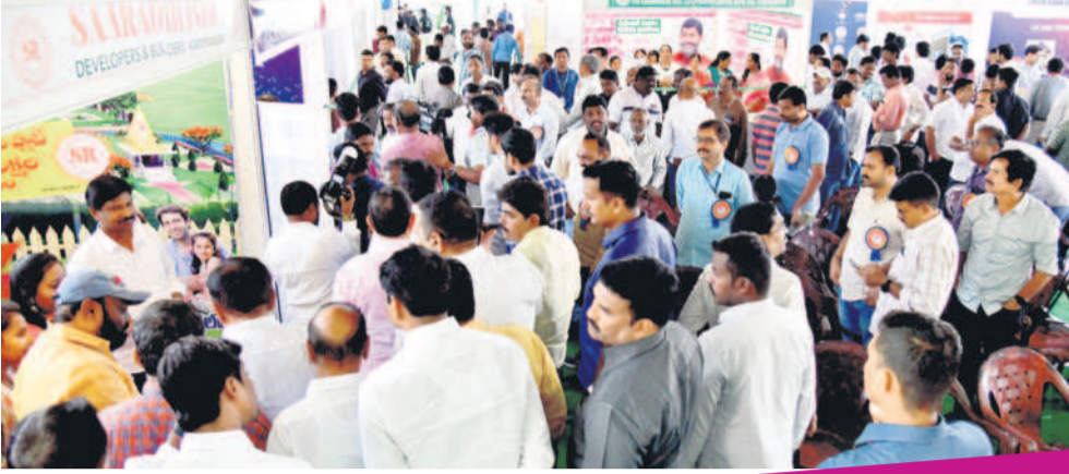
ప్రాచుర్య షోకు తరలివచ్చిన సందర్భాలు