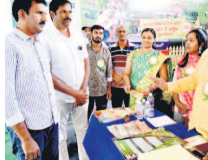
సారథి ఇన్ఫో స్టాల్లో సందర్భకులకు వివరిస్తున్నా..

కరీంనగర్ జిల్లాకేంద్రంలో 'నమస్తే తెలంగాణ', 'తెలంగాణ టుడే' సంయుక్తంగా ఏర్పాటు చేసిన ప్రాచుర్య షో అందింది. ఈ ఎక్స్ పోజు రెండు రోజులపాటు కొనసాగుతుంది. మొదటి రోజు శుక్రవారం విశేషం నడపబడింది. కలెక్టరేట్ ఎదుట ఉన్న రెవెన్యూ గార్డెన్ వందలాది మందికి కిటికీలూడింది. హైదరాబాద్, కరీంనగర్ కు చెందిన ప్రముఖ రియల్ ఎస్టేట్ వ్యాపార సంస్థలతోపాటు బ్యాంకులు పాల్గొని, సందర్భకులు పెద్ద సంఖ్యలో తరలివచ్చారు. స్టాళ్ల వద్దకు వెళ్లి వెంచర్లు, ఇండ్లు, అప్నామ్మెంట్లు బ్యాంకుల ద్వారా సంబంధించిన సమాచారం తెలుసుకున్నారు.