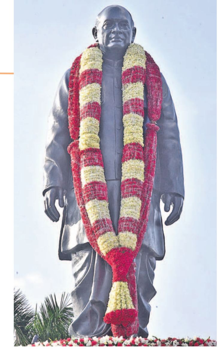
మన పీవీ.. భారతరత్న

'అన్నా.. రేవంతన్నా జర మమ్ముల్ని కాపాడు.. ప్రీ బస్ సర్వీస్ రద్దు చేసి.. మా ఆటో డ్రైవర్లను కాపాడుండి' అంటూ ఆటో వెనుక అక్షరాల రూపంలో.. తన ఆవేదన వ్యక్తం చేస్తున్నా ఆటో డ్రైవర్. ఉచిత బస్సు పథకంతో ఆటో డ్రైవర్లు ఇబ్బందులు పడుతూ.. నిరసనలు తెలుపు తున్న క్రమంలో తన బాధను తెలియజేస్తున్నాడు. చూట్టి గూడ-నాచారం రోడ్డులో కనిపించింది దృశ్యం. -ఉప్పర్