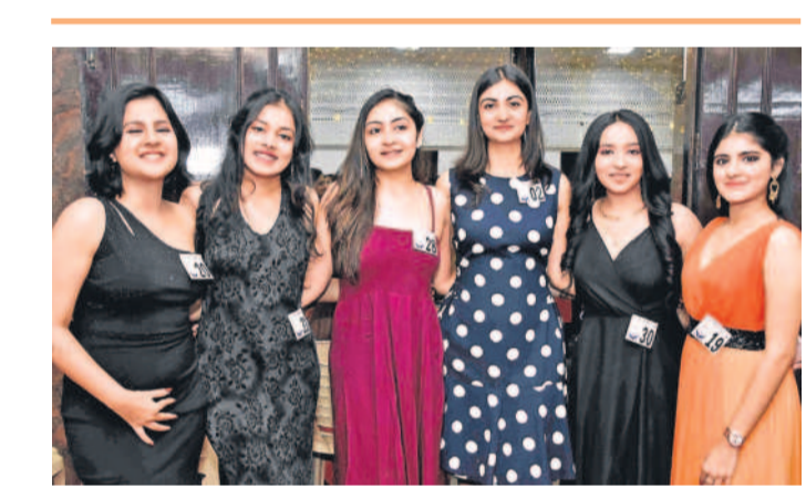
నికింద్రాబాద్ ఎస్పీ రోడ్ లోని గజాబీ స్కూల్ లో గజాబీ ఎక్కా మసఖ్ త్రిమి ఉత్సాహంగా సాగింది. ఈ సందర్భంగా మిన అండ్ మిన పేరిట బిగిని కార్యక్రమంలో అతివలు సందడి చేశారు.

సిటీబ్యూరో, ఫిబ్రవరి 9 (నమస్తే తెలంగాణ): నగరంలో ట్రాఫిక్ నియంత్రణకు అవసరమైన ఆంక్షల అభివృద్ధికి ప్రతి పాదనలు సిద్ధం చేయాలని కమిషనర్ రోనాల్డ్ రాస్ అధికారులను ఆదేశించారు. శుభ్రాచారం సాయంత్రం కమిషనర్ తన చాంబర్లో టాన్స్ పాస్ అని, ఇంజనీరింగ్ అధికారులతో ఏర్పాటు చేసిన సమావేశంలో మాట్లాడారు. పాదచారుల ప్రయాణం నివారణకు అవసరమైన చోట పుట్ల ట్రిప్లీ నిర్మాణాలకు స్థలం గుర్తించాలని అధికారులను ఆదేశించారు. ఇప్పటికే నగరంలో 22 పుట్ల ట్రిప్లీలను చేపట్టగా ఇప్పటి వరకు 11 అందుబాటులోకి వచ్చాయన్నారు.