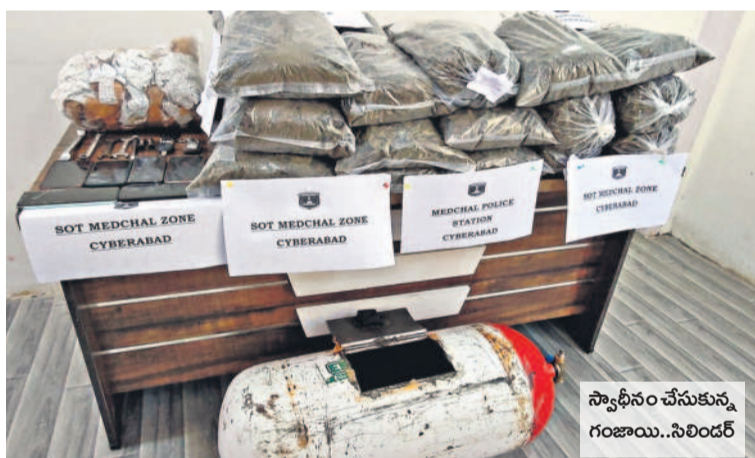
స్వాధీనం చేసుకున్న గంజాయి.. సిలిండర్

షెడ్యూల్లోనే బస్సులు ప్రయాణికుల కోసం నిలుపుతున్నాయని ఆర్టీసీ గ్రేటర్ అధికారులు స్పష్టం చేస్తున్నారు. అయితే నగరంలోని ప్రధాన ప్రాంతాల్లో ట్రాఫిక్ నియంత్రణ కోసం గుర్తించిన చోట్ల ఉన్న బస్ షెడ్యూల్లో బస్సులు నిలువవద్దని పోలీసు అధికారులు స్పష్టం చేస్తున్నారు. దీనిపై ప్రభుత్వం తని నిర్ణయం తీసుకుంటే దాని ప్రకారమే బస్ షెడ్యూల్లో బస్సులు నిలుపాలా? లేదా? అనేదానిపైనే ఆర్టీసీ యాజమాన్యం కూడా నిర్ణయం తీసుకుంటుందని చెబుతున్నారు. మొత్తానికి బస్ షెడ్యూల్లో సిటీ బస్సులు నిలువడం విషయమై పోలీసు, జీహెచ్ఎస్ఐ, ఆర్టీసీ యాజమాన్యాల మధ్య ప్రస్తుతం సమస్యయం కొరవడినట్లు తెలుస్తున్నది. కాగా, రెండు రోజుల కిందట జీహెచ్ఎస్ఐ ప్రధాన కార్యాలయంలో నగర పోలీసు విభాగంతో పాటు ఆర్టీసీ గ్రేటర్ అధికారులతో జీహెచ్ఎస్ఐ ఉన్నతాధికారులు అధ్యక్షులతో సమన్వయ సమావేశం ఏర్పాటు చేసినట్లు సమాచారం. దీనిపై మూడు ప్రభుత్వ విభాగాల్లో విభిన్న అభిప్రాయాలు వ్యక్తమైనట్లు చెబుతున్నారు. అయితే ప్రయాణికులు చూడతూ తమకు అందబాటులో బస్ షెడ్యూల్ ఏర్పాటు చేయడం వల్ల ప్రయాణం సౌకర్యవంతంగా ఉంటుందని, లేదంటే ఆలోచించి, ఇతర ప్రైవేటు వాహనాల్లో వెళ్లాల్సి వస్తుందని, ఇది తమకు తలకుమిందిన ఆర్థిక భారంగా మారుతుందని ఆవేదన వ్యక్తం చేస్తున్నారు.