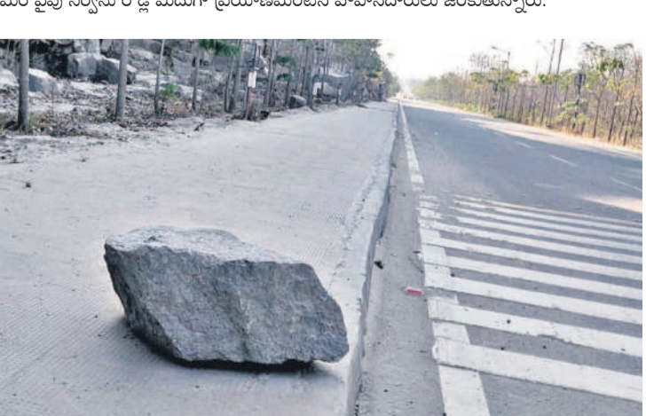
రాజేంద్రనగర్ నుంచి శంషాబాద్ మార్గంలోని సర్వీసు రోడ్డులో జారిపడిన బండరాళ్లు

సిటీబ్యూరో, ఫిబ్రవరి 9 (నమస్తే తెలంగాణ): ఓఆర్ఆర్ సర్వీస్ రహదారిపై జారిపడుతున్న బండరాళ్లు.. ప్రయాణికుల గుండెల్లో రైళ్లు పరిగెత్తిస్తున్నాయి. రింగు రోడ్డు నిర్మాణంలో భాగంగా కొన్ని చోట్ల భారీ ఎత్తులను గుట్టలను తొలిచి.. రోడ్డు మార్పిణి నిర్వహించారు. అలాంటి ప్రాంతాల్లో గుట్టల నుంచి బండరాళ్లు జారి.. సర్వీసు రోడ్డు మీదకు వస్తున్నాయి. తరచూ ఇలా జరుగుతుండటంతో టెటర్ సర్వీసు రోడ్డు మీదకు వచ్చే ప్రయాణికులు భయపడుతున్నారు. ముఖ్యంగా నార్సింగి నుంచి తెలంగాణ పోలీస్ అకాడమీ వరకు ఉన్న మార్గంలో మంచినీరేవు వద్ద, రాజేంద్రనగర్-హిమాచల్ నగర్ ఇంటర్వేయ్ నుంచి శంషాబాద్ వరకు ఉన్న రెండు మార్గాల్లో ఎత్తులను గుట్టల మధ్య నుంచే టెటర్ నుంచి నిర్వహించారు. ఆయా ప్రాంతాల్లోని సర్వీసు రోడ్డుపై ఎప్పుడు బండరాళ్లు జారి మీద పడుతుంటేనేనే భయం వాహనదారుల్లో నెలకొన్నది. ముఖ్యంగా రాత్రి వేళల్లో కొన్ని ప్రాంతాల్లో సర్వీసు రోడ్డు మీద రాకపోకలు సాగించలేదని పరిస్థితి ఉంది. మహానగరానికి మణిహారంలా మారిన టెటర్ రింగు రోడ్డుపై ఉన్న ప్రధాన రహదారి నిర్వహణ సజావుగానే ఉన్నా.. దానికి ఇరువైపులా ఉన్న సర్వీసు రహదారుల నిర్వహణను సరిగా చేపట్టడం లేదని వాహనదారులు వాపోతున్నారు. ఇదిలా ఉంటే గచ్చిబౌలి నుంచి శంషాబాద్ వరకు ఉన్న ఓఆర్ఆర్ సర్వీసు రోడ్డుపై భవన నిర్మాణ రంగానికి సంబంధించిన సామగ్రితో భారీ వాహనాలు రాకపోకలు సాగిస్తున్నాయి. వాహనాల్లోంచి మట్టి, కంకర సైతం పడుతున్నా, దాన్ని ఎప్పుటికప్పుడు తొలగించడం లేదు. అటు జారిపడుతున్న బండరాళ్లు ఒకవైపు.. మట్టి, కంకర మరోవైపు సర్వీసు రోడ్డు మీదగా ప్రయాణమంటేనే వాహనదారులు ఇంకుతున్నారు.