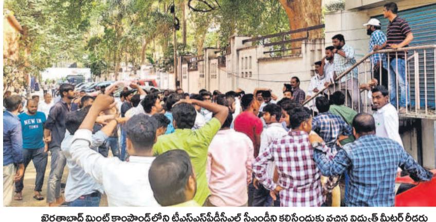
హైదరాబాద్ మిల్ కాంపౌండ్ లోని టీఎన్ఎస్ఐడీసీఎల్ సీఎంఢీని కలిసేందుకు వచ్చిన విద్యుత్ మీటర్ రిడర్లు

15 హైదరాబాద్, శనివారం 10 ఫిబ్రవరి 2024 HYDERABAD