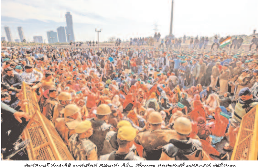
పార్లమెంట్ ముట్టడికి బయల్దేరిన రైతులను ఢిల్లీ-నోయిడా సరిహద్దుల్లో అడ్డగించిన పోలీసులు