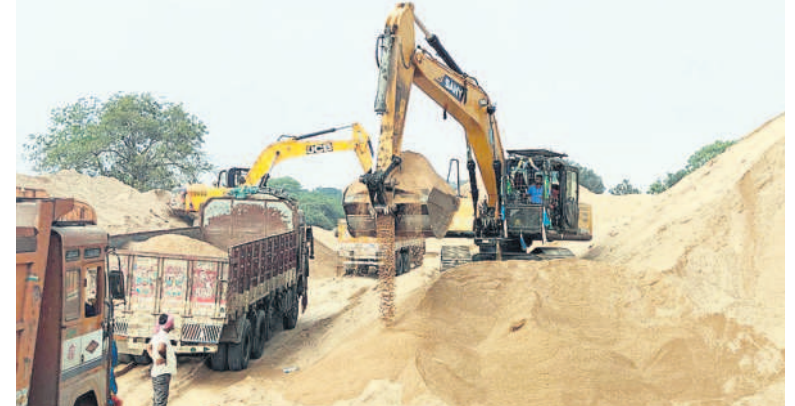
ఓదెల మండలం గుండ్లపల్లి వద్ద లారీల్లో చేస్తున్న ఇసుక లోడింగ్

ఇసుక ధరలకు ఒక్కసారిగా రెక్కలు వచ్చాయి. క్యారీల మూతతో అమాంతం పెరిగిన ధరలను చూసి సామాన్యలు బెంబేలెత్తుతున్నారు. బుకింగ్ నుంచి ట్రాన్స్పోజిట్టు దాకా అదనంగా చెల్లింపుల వస్తున్నదని వాపోతున్నారు. పెద్దపల్లి జిల్లా నుంచి హైదరాబాద్ తరలింపు చేయడం లారీ ఒక్కో ట్రైప్ ను అదనంగా ₹ 10 వేలకు పైనే అవుతున్నాయని చెబుతున్నారు. ప్రజలకు మేలు చేయాలని ప్రభుత్వం ఇలా క్యారీలు మూసివేసి ఇలా ఆర్థికంగా ఇబ్బంది పెట్టడం సరికాదని సూచిస్తున్నారు.