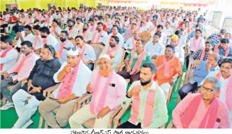
హాజరైన బీఆర్ఎస్ పార్టీ కార్యకర్తలు