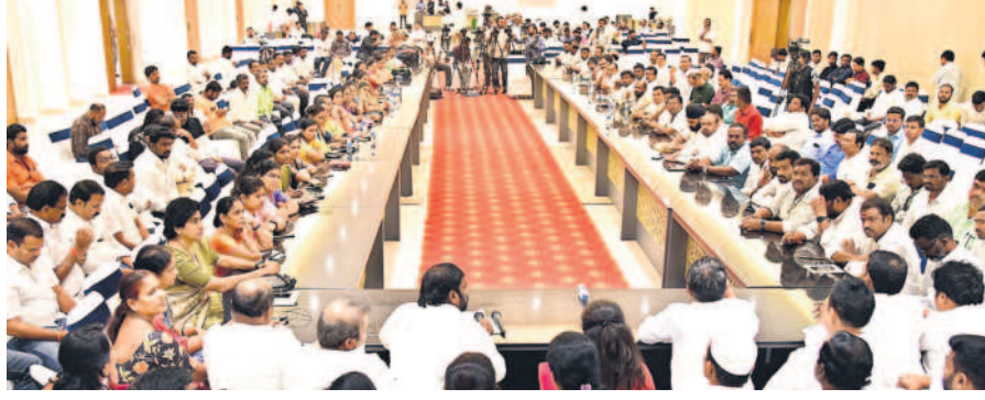
రౌండ్ టేబుల్ సమావేశానికి హాజరైన బీసీ కుల సంఘాల ప్రతినిధులు