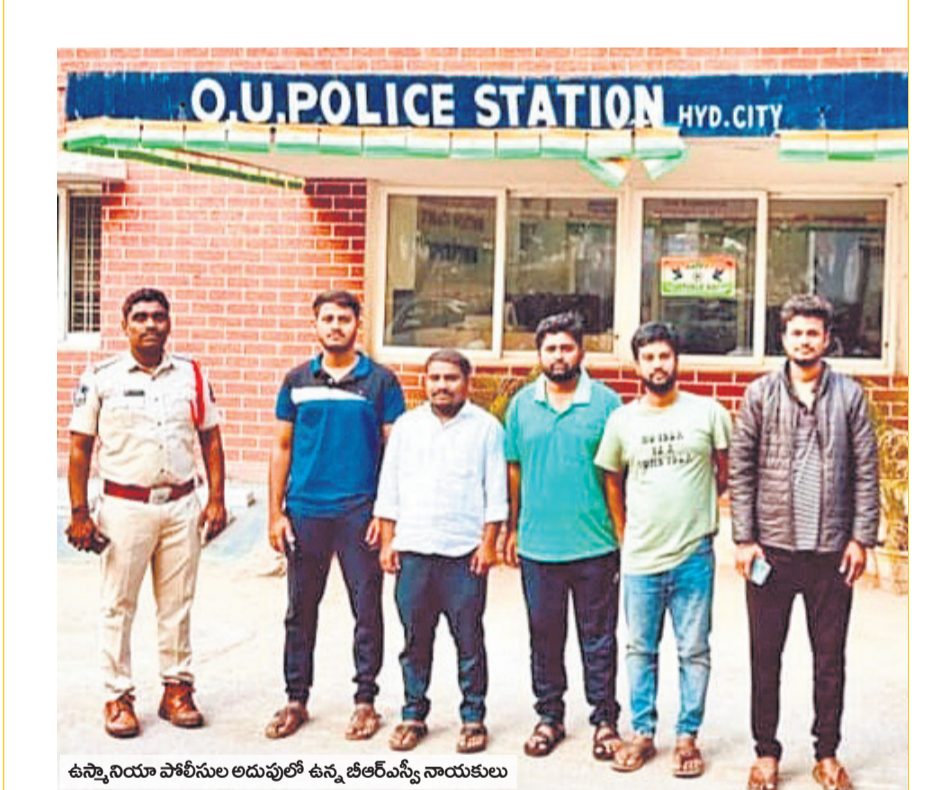
ఉస్మానియా పోలీసుల అదుపులో ఉన్న బీఆర్ఎస్ నాయకులు