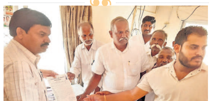
పాబాద్ ఏఈ నరేంద్రులకు వినతిపత్రం అందజేస్తున్న భారతీయ కిసాన్ సంఘ సభ్యులు

ఈ నెల 12 వరకు నిర్వహణ : బోంబాయి, ఫిబ్రవరి 5 : పదో తరగతిలో మెరుగైన ఫలితాల లక్ష్యంగా విద్యార్థులు ఈ ఏడాది కొత్తగా ప్రత్యేక పరీక్షలను నిర్వహిస్తున్నారని, ఈ పరీక్షలు సోమవారం ప్రారంభం కాగా.. ఈ నెల 12వ తేదీ వరకు కొనసాగుతున్నాయి. వార్షిక పరీక్షల నాటికి విద్యార్థులు పరీక్షలపై పట్టు సాధించి మంచి మార్కులు సాధించాలన్న ఉద్దేశంతోనే అధికారులు వీటిని నిర్వహిస్తున్నారు. ఉదయం 10 నుంచి మధ్యాహ్నం 2.00 వరకు పరీక్ష నిర్వహించి మధ్యాహ్నం 1.45 నుంచి సాయంత్రం 5.30 వరకు మరునాటి రోజు నిర్వహించే పరీక్షకు విద్యార్థులను చదివించి నిర్ణయం చేస్తున్నారు. అదేవిధంగా వార్షిక పరీక్షలకు ముందు నిర్వహించే టై-ప్రేజ్ పరీక్షలను ఈ నెల 22వ తేదీ నుంచి 29వ తేదీ వరకు నిర్వహించనున్నారు. వీటికి విద్యార్థులను అన్ని విధాలుగా ఉత్సాహం చేస్తున్నారు.