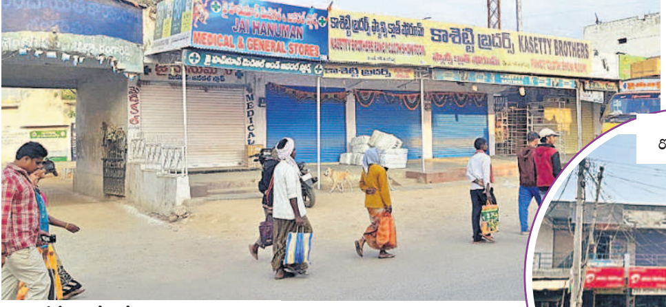
రైల్వేస్టేషన్ రోడ్డులోని మున్సిపల్ దుకాణాలు

శంకర్పల్లి, ఫిబ్రవరి 5 : శంకర్పల్లి మున్సిపాలిటీకి వచ్చే ఆదాయానికి గండిపడుతున్నా అధికారులు, ప్రజాప్రతినిధులు స్పందించడంలేదు. శంకర్పల్లి గ్రామ పంచాయతీగా ఉన్నప్పటి నుంచీ అతి తక్కువ ఆదాయం వెళ్లిస్తూ కొందరు దుకాణదారులు కొన్నేండ్లుగా వ్యాపారాలను నిర్వహిస్తున్నారు. మున్సిపల్ పరిధిలో 238 దుకాణాలుండగా ఒక్కో దుకాణానికి కనీసంగా రూ. 500, గరిష్టంగా రూ. 1,500 అద్దె మాత్రమే చెల్లిస్తూ ప్రభుత్వ ఖజానాకు గండికొడుతున్నారు. మున్సిపాలిటీ నిబంధనల ప్రకారం దుకాణ సముదాయానికి రీ-టిండర్ నిర్వహించాలి అన్న వర్గాల వారికి కేటాయింబాల్సి ఉంటుంది. కానీ అధికారులు ఆ దిశగా చర్యలు తీసుకోవడంలేదు. మున్సిపాలిటీకి రావాల్సిన ఆదాయానికి అధికారులు కూడా ఒక రకంగా అడ్డుపడుతున్నారని స్థానికులు మండిపడుతున్నారు. ఇది గ్రామాలను కలిపి 2018లో శంకర్పల్లిని మున్సిపాలిటీగా ఏర్పాటుచేశారు. మున్సిపాలిటీ వేర్వేరు నాటి నుంచీ దుకాణ సముదాయానికి రీ-టిండర్ చేస్తామని పలువురు కలెక్టర్లు పిర్యారు చేశారు. అయితే కలెక్టర్ ఆదేశాలను అధికారులు పట్టించుకోవడంలేదు. అలాగే అధికారులు స్థానిక ప్రజాప్రతినిధుల ఒత్తిళ్ల, అధికారుల అందడంతో తెలియదుకానీ దుకాణాల రీ-టిండర్ ప్రక్రియ జరుగడంలేదు. ప్రస్తుతం మున్సిపల్ దుకాణాలవల్ల దాదాపుగా రూ. 15 లక్షల వరకు ఆదాయం వస్తుంది. మళ్లీ టిండర్ నిర్వహిస్తే రూ. 2 కోట్లకు పైగా ఆదాయం వచ్చే అవకాశం ఉన్నది. పక్కనే ఉన్న ఆర్టీసీ కాంప్లెక్స్ లో ఒక్కో దుకాణానికి కనీసంగా రూ. 15 వేలు గరిష్టంగా రూ. 30వేల వరకు ప్రతివేలా అద్దె వసూలు వుతున్నది. ఇప్పటికే ఉన్న అధికారుల నుండి 238 మున్సిపల్ దుకాణాలకు మళ్లీ టిండర్ పిలవాలని శంకర్పల్లి మున్సిపల్, మండల ప్రజలు కోరుతున్నారు.