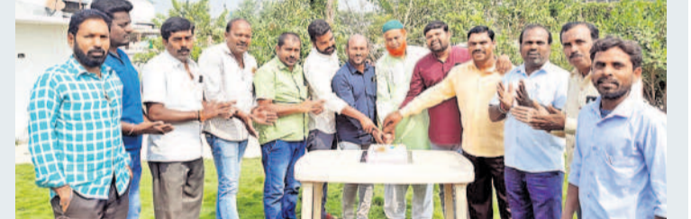
కోహడలో ఇండ్రీలో జన్మదిన వేడుకలు నిర్వహిస్తున్న కార్యక్రమం