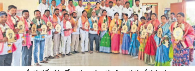
అత్యున్నత సమైక్యంలో భాగంగా సత్కారం పొందిన మాజీ సర్దంపలు