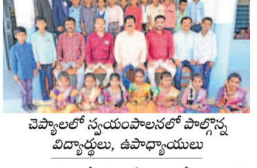
చెప్పాలలో స్వయంపాలనలో పాల్గొన్న విద్యార్థులు, ఉపాధ్యాయులు

మిరడొడ్డి, ఫిబ్రవరి 5: మండలంలోని చెప్పాల ప్రాథమిక పాఠశాలలో సోమవారం స్వయంపాలన దినోత్సవాన్ని ఘనంగా నిర్వహించారు. ఈ సందర్భంగా విద్యార్థులు ఉపాధ్యాయులు లుగా హారీ తోటి విద్యార్థులకు పాఠాలు బోధించారు. కార్యక్రమంలో ఉపాధ్యాయులు, విద్యార్థులు, పాఠశాల సిబ్బంది పాల్గొన్నారు.