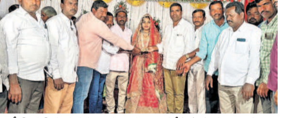
సీహెచ్ డి కారులకు అర్థక సాయం అందజేస్తున్న పూర్వ విద్యార్థులు