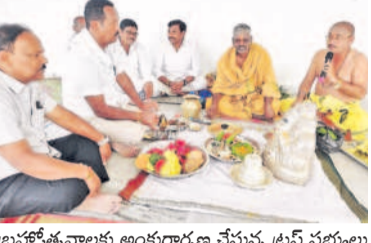
ప్రత్యోత్సవాలకు అంకరణ చేస్తున్న క్షేత్ర సభ్యులు

కొండపాక, ఫిబ్రవరి 5: 'శివశంకర.. మహాదేవ' అంటూ భక్తులు శివనామస్మరణతో దుర్గైక పరసర ప్రాంతాల మార్చాగారు. నాటి నుంచి నేటి వరకు ఏటా ఈ క్షేత్రంలో ఉత్సవాలు నిర్వహించుకోవడం ఆనవాయితీ. సోమవారం అంతరార్థణ జరిపి గణపతి పూజతో జాతర ఉత్సవాలు ప్రారంభమయ్యాయి. స్వస్థానావసరం, మండపారాధన, శివునికి మహానామ స్మరణ కర్మలకు అంజనం, అన్నాది పేకం, అంకరణ, తీర్ధప్రసాద వితరణ నిర్వహించారు. అమ్మవారికి అభిషేకం అంకరణ, ఒడి దీపారాధన సమర్పణ కార్యక్రమాలు కనుల పండుకగా జరిగింది. ఉత్సాహం భాగంగా తొలిరోజు ముఖ్యమైన ఘట్టం శకటోత్సవం (బండ్లు తిరుగుట) నేత్ర పర్వంగా సాగింది. సంప్రదాయబద్ధంగా సర్ గోపా