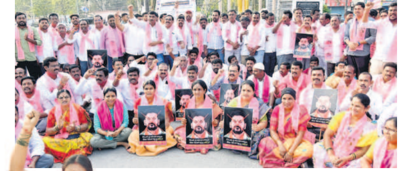
సిరిసిల్లలో దర్శా చేస్తున్న బీఆర్ఎస్ నాయకులు, కార్యకర్తలు