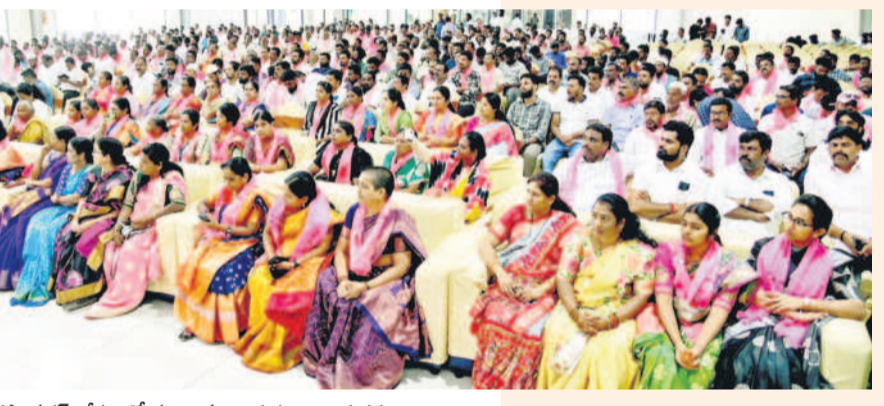
కరీంనగర్: రేకుల్లో హాజరైన నాయకులు, కార్యకర్తలు