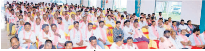
తిమ్మాపూర్: అల్లునూర్లో హాజరైన నాయకులు, కార్యకర్తలు

కరీంనగర్, ఫిబ్రవరి 5 (సమస్తి తెలంగాణ) / తిమ్మాపూర్ : పార్లమెంట్ ఎన్నికల్లో కలిసి కట్టుగా పనిచేద్దామని, బీఆర్ఎస్ ను గెలిపిద్దామని గులాబీ శ్రేణులకు మాజీ ఎంపీ బోయినపల్లి వినోద్ కుమార్ పిలుపునిచ్చారు. ప్రజలను ఎన్నికలకు సన్నద్ధం చేయాలని సూచించారు. ఎన్నికల్లో గెలుపోటములు సహజమని, ఇప్పుడు మనం మళ్లీ గెలిచి తీరుతామని ధీమా వ్యక్తం చేశారు. సోమవారం రేపల్లెలోని ఓ గార్డెన్, అల్లునూర్లోని ఓ ఫంక్షన్ హాల్ లో వేర్వేరుగా జరిగిన కరీంనగర్, మానకొండూర్ నియోజకవర్గాల బీఆర్ఎస్ కార్యకర్తల విస్తృత స్థాయి సమావేశాలకు ఆయన ముఖ్య అతిథిగా హాజరయ్యారు. రాబోయే పార్లమెంట్ ఎన్నికల్లో అనుసరించాల్సిన పూర్వహంపై దిశానిర్దేశం చేశారు. కాంగ్రెస్, బీజేపీ వైఫల్యాలను ఎండగట్టాలని, వాస్తవాలను ప్రజలకు వివరించాలని కార్యకర్తలకు నిర్దేశించారు. తాను పక్కాలోకల్ అని ప్రకటించుకున్న ఎంపీ బండి నంబయ్యకు దిమ్మతిగిరి సమాధానం ఇచ్చారు. సంజయ్ పుట్లక ప్రజలకు ముందే తాను కరీంనగర్లో పుట్టానని, ఐదు జిల్లాల పరి