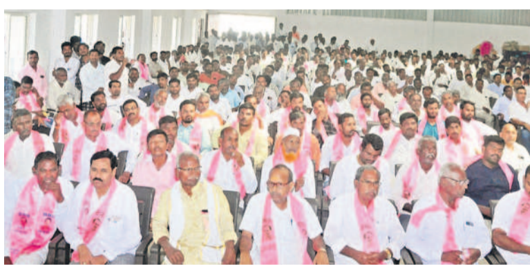
నారాయణపేట నియోజకవర్గ సమావేశానికి హాజరైన నాయకులు, కార్యకర్తలు