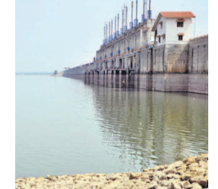
జూరాల ప్రాజెక్టులో ప్రస్తుత నీటి నిల్వ

తం కాంగ్రెస్ ప్రభుత్వం కృష్ణా జలాలను కేంద్ర జలవనరుల శాఖకు అప్పగించడంతో నెట్టింపాడి లిఫ్ట్ మాత్రమే అవకాశం లేకపోయింది. దాని కింద ఆయకట్టు ప్రస్తావనం కానున్నది. నీటిని తీసుకునేందుకు అనుమతి తప్పనిసరి కానుండడంతో నెట్టింపాడి ప్రాజెక్టు కింద ప్రస్తుతం పచ్చని పైకెత్తే కళకళలాడి భూములు ఇక నెలెలిచ్చి బీడు భూములుగా మారే అవకాశం లేకపోయింది.