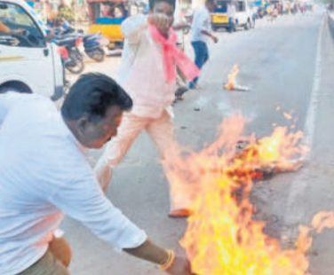
కొత్తకోటలో నిరసన తెలుపుతున్న బీఆర్ఎస్ ప్రజాప్రతినిధులు, నేతలు