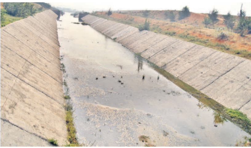
నీళ్లు పారకపోవడంతో బోసిపోయి దర్శనమిస్తున్న కాల్వ

జూరాల ప్రాజెక్టుకు ఎగువన ఉన్న కర్ణాటకలోని ఆల్పట్టి, నారాయణపూర్ నుంచి వరద వచ్చి చేరుతున్నది. అయితే కృష్ణా ప్రాజెక్టులను కేంద్రం జలవనరుల శాఖను ఆపుగించడంతో జూరాల ప్రాజెక్టు పరిస్థితి రెంటికి చెక్కే రేపటికే తయారైంది. ఎగువన వరదలు వచ్చినప్పుడు దిగువకు నీరు విడుదలయ్యేది. ఇక్కడికి వచ్చిన నీటిని జూరాలలో స్టోరేజీతోపాటు బ్యాక్ వాటర్ నుంచి నెట్టింపాడి ఎత్తిపోతలకు తరలివేవారు. కానీ ఇక ఆ పరిస్థితికి అవకాశం లేదు. వచ్చే ప్రతి నీటి చుక్కకు లెక్క చూపాలి. ప్రపంచంలో ఏర్పడిన నీటిని ఆర్జీ చేసుకోవాలి. ఇప్పుడే జూరాల ప్రాజెక్టులో పూడిక నిండి పోవడంతో ప్రస్తుతం 8 నుంచి 7 టీఎంసీల నీటిని మాత్రమే నిల్వ చేసుకొనే అవకాశం ఉన్నది. ఎగువ నుంచి నీరు రాకపోతే జూరాల ప్రాజెక్టు ఎండిపోయే ప్రమాదం ఉన్నది. ఈ డ్యాంపై ఆధారపడిన ఆయకట్టుతోపాటు వరద సమయంలో నికర జలాలను వినియోగించుకోనే అవకాశాన్ని కోల్పోయే ప్రమాదం ఏర్పడుతుంది. దీని పరిధిలో ఏర్పాటు చేసిన లిఫ్టుపై ఆ ప్రభావం పడే అవకాశం ఉంది. జూరాల ప్రాజెక్టు కింద కడి కాల్వ ద్వారా జోగులాంబ గద్వాల జిల్లాలో 35,657 ఎకరాలకు, ఏడవ ప్రధాన కాల్వ కింద 69,084 ఎకరాలకు అయకట్టు (వనపర్తి, నాగర్ కర్నూల్ జిల్లాలో) సాగులోకి 2005 సంవత్సరం నుంచి వచ్చింది. ప్రస్తుతం జూరాలలో నీటి లభ్యత లేని కారణంగా యాసంగి పంటలకు విరామం ఇచ్చారు.