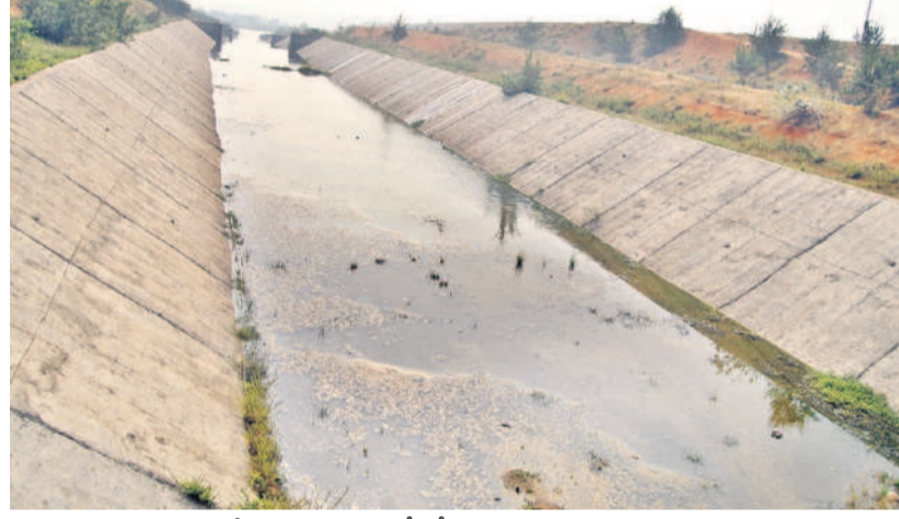
నీళ్లు పారకపోవడంతో బోసోపాడు దర్శనమిస్తున్న కాల్య

జూరాల ప్రాజెక్టుకు ఎగువన ఉన్న కర్ణాటకలోని ఆల్పల్లీ, నారాయణపూర్ నుంచి వరద వచ్చి చెరువులున్నది. అయితే కృష్ణా ప్రాజెక్టులను కేంద్రం జలవనరుల శాఖకు అప్పగించడంతో జూరాల ప్రాజెక్టు పరిస్థితి రెంటికి చెక్క రేవడిలా తయారైంది. ఎగువన వరదలు వచ్చినప్పుడు దిగువకు నీరు విడుదలయ్యేది. ఇక్కడికి వచ్చిన నీటిని జూరాలలో స్టోరేజీతోపాటు బ్యాక్ వాటర్ నుంచి నెట్టంపాడు ఎత్తిపోతలకు తరలించేవారు. కానీ ఇక ఆ పరిస్థితికి అవకాశం లేదు. వచ్చే ప్రతి నీటి చుక్కకు లెక్క చూపాలిగా మారడంతో నీటిపై హక్కును కోల్పోయే ప్రమాదం ఏర్పడింది. ఇప్పటికే జూరాల ప్రాజెక్టులో పూడిక నిండి పోవడంతో ప్రస్తుతం 8 నుంచి 7 టీఎంసీల నీటిని మాత్రమే నిల్వ చేసుకొనే అవకాశం ఉన్నది. ఎగువ నుంచి నీరు రాకపోతే జూరాల ప్రాజెక్టు ఎండిపోయే ప్రమాదం ఉన్నది. ఈ ద్వారానే ఆధారపడిన ఆయకట్టుతోపాటు వరద సమయంలో నీటిని జూరాలను వినియోగించుకోనే అవకాశాన్ని కోల్పోయే ప్రమాదం ఏర్పడుతుంది. దీని పరిధిలో ఏర్పాటు చేసిన లిఫ్టుపై ఆ ప్రభావం పడే అవకాశం ఉంది. జూరాల ప్రాజెక్టు కింద కడి కాల్య ద్వారా జోగుళాంబ గద్వాల జిల్లాలో 35,657 ఎకరాలకు, పడమ ప్రధాన కాల్య కింద 69,084 ఎకరాలకు ఆయకట్టు (వనపర్తి, నాగర్ కర్నూల్ జిల్లాలో) సాగులోకి 2005 సంవత్సరం నుంచి వచ్చింది. ప్రస్తుతం జూరాలలో నీటి అభ్యంతరం కారణంగా యాసంగి పంటలకు విరామం ఇచ్చారు.