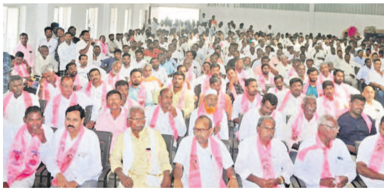
నారాయణపేట నియోజకవర్గ సమావేశానికి హాజరైన నాయకులు, కార్యకర్తలు