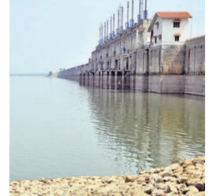
జూరాల ప్రాజెక్టులో ప్రస్తుత నీటి నిల్వ

తం కాంగ్రెస్ ప్రభుత్వం కృష్ణా జిల్లాలను కేంద్రం జలవనరుల శాఖకు అప్పగించడంతో నెట్టంపాడు రైతుల పరిస్థితి ఆగమ్య గోచరంగా మారనున్నది. జూరాల ప్రాజెక్టు ఉమ్మడి పాలనామూల జిల్లాల వర్షపాదాన్నిగా ఉండగా.. ఇటు జోగుళాంబ అందించడంతోపాటు మిషన్ జీగర్ల పథకానికి సైతం ఈ జిల్లాలను సుదీర్ఘ వినియోగిస్తున్నారు. ప్రస్తుతం మన ప్రాజెక్టులు కేఆర్ఎంబీ పరిధిలోకి వెళ్లడంతో జిల్లాల నడిగడ్డ ప్రజలతోపాటు ఉమ్మడి జిల్లా సులకు సాగు, తాగునీటి కష్టాలు ఎదురవుతున్నాయి. మన ప్రాంతానికి చెందిన నేత రేవంత్ సీఎం కావడంతో కష్టాలు తీరుతాయని భావించిన ఉమ్మడి జిల్లా ప్రజలకు కేఆర్ఎంబీకి ప్రాజెక్టులను దానేహం చేయడంతో రాజకీయ సార్థం కోసం ఈ పనిచేసారని ఆందోళన చెందుతున్నారు. కాంగ్రెస్ ప్రభుత్వం చేసిన పొరపాటుతో