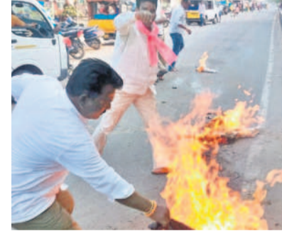
సీఎం దిష్టిబొమ్మను దహనం చేస్తున్న బీఆర్ఎస్ నేతలు