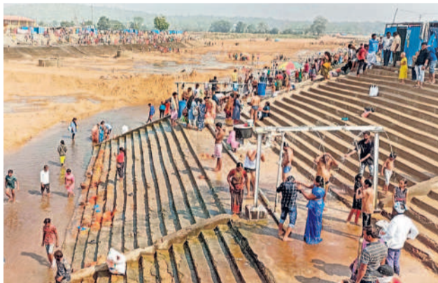
జంపన్న వాగులో స్నానాలాచరిస్తున్న భక్తులు