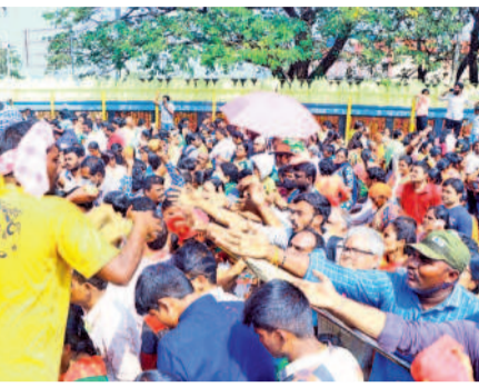
బంగారం కోసం పోటీపడుతున్న భక్తులు