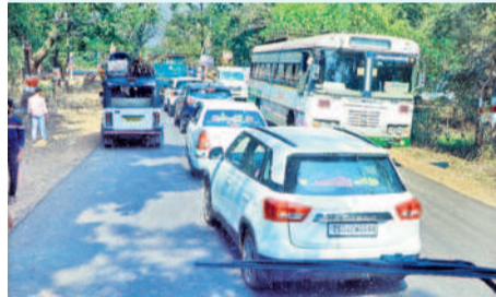
మేడారం దారిలో వాహనాల రద్దీ

వనదేవతల సమ్మక్క-సారలమ్మ దర్శనానికి భక్తులు పోలితారు. ఆదివారం సెలవు కావడంతో వివిధ ప్రాంతాల నుంచి ప్రైవేట్, ఆర్టీసీ బస్సుల్లో లక్షలాది మంది భక్తులు మేడారానికి తరలివచ్చారు. ఎటు చూసినా దారులన్నీ నిండిపోయి కనిపించాయి. మొదటి అమ్మవార్లకు తలసరిలాలు సమర్పించి జంపన, వాగులో పుణ్యస్నానాలు ఆప రించారు. అమ్మవార్ల గడ్డలపై ఎత్తు బంగారం, పసుపు, కుంకుమ, పూలు, పండ్లు, వస్త్రాలు, ఒడిబియ్యం సమర్పించి మొక్కులు చెల్లించుకున్నారు. మేడారం- నార్కా పూర్, మేడారం-తాడ్యాయి, ఊరట్లం-కాల్యపల్లి, కొత్తూరు ప్రాంతాల భక్తులతో నిండిపోయాయి. సుమారు 6లక్షల మంది భక్తులు వనదేవతలను దర్శించుకున్నట్లు దేవదారులు శాఖ అధికారులు తెలిపారు. 5 కిలోమీటర్ల మేర వాహనాలు రోడ్డుకు ఇరు వైపులా నిలిచాయి. రద్దీ అధికంగా ఉండటంతో ట్రాఫిక్ సమస్యలు తలెత్తకుండా ములుగు ఎస్సీ శబరీష్ పర్వవేగించారు. రోడ్లపై వాహనాలు నిలువకుండా చర్యలు చేపట్టారు. భక్తులకు ఇబ్బందులు కలుగుకుండా క్యూలో అనుమతించారు.