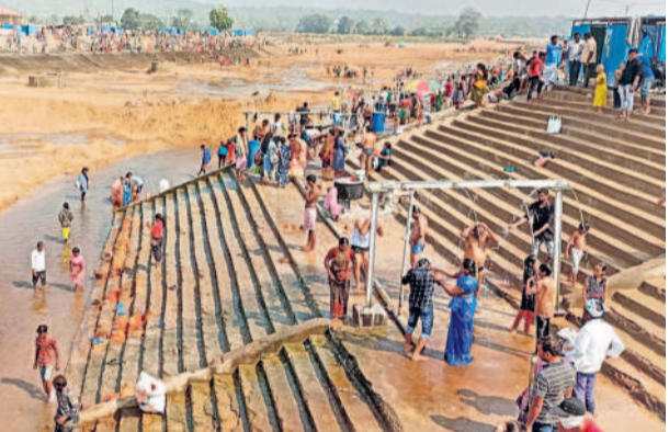
జంపన్న వాగులో స్నానాలాచారస్తున్న భక్తులు