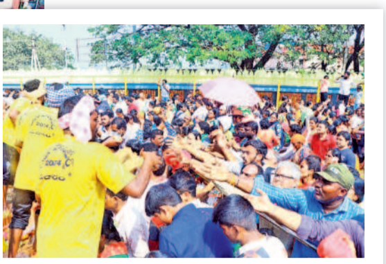
బంగారం కొనుగోలు పోటీపడుతున్న భక్తులు