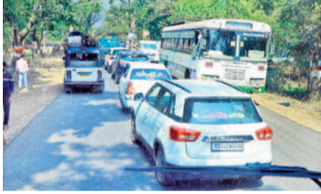
మేడారం దారిలో వాహనాల రద్దీ