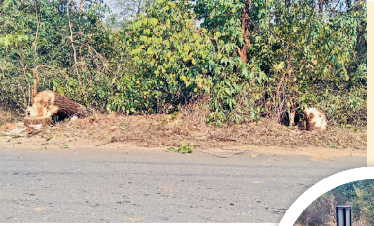
కమలాపూర్-రాంపూర్ మధ్య రోడ్డు వెంట నరికేసిన చెట్లు

జయశంకర్ భూపాలపల్లి, ఫిబ్రవరి 4 (నమస్తే తెలంగాణ) : మేడారం దారిలో చెట్లు నేలకొరకుతున్నాయి. మొయింటెనెన్స్ లో భాగంగా చేస్తున్న జంగిల్ కటింగ్ పేరుతో భారీ వృక్షాలను నరికేస్తున్నారు. మేడారం సమృద్ధిగా సారలమ్మ మహాజాతర సమీపి స్పందనతో జిల్లాలోని భూపాలపల్లి మండలం కమలాపూర్ రోడ్డు, కాటారం రోడ్డు పాడవుతూ మేడారం వరకు రోడ్డుకు ఇరువైపులా ఆర్ అండ్ బీ అధికారులు జంగిల్ కటింగ్, సైడిబల్డ్, మొయింటెనెన్స్ పనులను ప్రారంభించారు. మొత్తం 75 కిలోమీటర్ల పాడవుతూ రూ. 15 లక్షలతో చేపట్టిన ఈ పనుల్లో చెట్లను తొలగిస్తున్నారు. కాటారం రోడ్డు పాడవుతూ మేడారం వరకు 50 కిలోమీటర్ల, భూపాలపల్లి మండలం కమలాపూర్ రోడ్డు పాడవుతూ 25 కిలోమీటర్ల జంగిల్ కటింగ్ పనులు కొనసాగుతున్నాయి. రోడ్డుకు ఇరువైపులా చదును చేయడం, అవసరమైన చోట సైడిబల్డ్ పోయడం, వాహనాలకు అడ్డ వచ్చే చెట్ల కొమ్మలను కట్టే చేయిస్తున్నారు. అయితే చెట్లను మాత్రం తొలగించొద్దు. కానీ మండలంలోని కమలాపూర్, రాంపూర్ గ్రామాల మధ్య జంగిల్ కటింగ్ భాగంగా యెట్ల చూగ చెట్లను నరికేస్తున్నారు. ఈ రోడ్డు