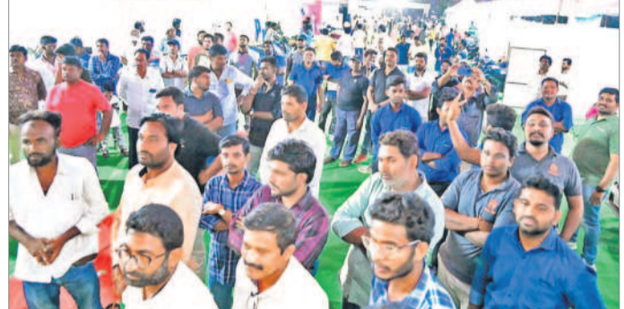
ప్రదర్శనకు విచ్చేసిన వాహన ప్రేమికులు

రఘునాథపాలెం, ఫిబ్రవరి 4: వాహన ప్రేమికుల కోసం ఐమ్మెంట్ లోని ఎన్ఆర్ ఆండ్ బీజీఎన్ఆర్ కళాశాల గ్రాండ్ లో 'రెండ్రోజీ' పాటు 'నమస్తే తెలంగాణ', తెలంగాణ టుడే' పత్రిక ఆధ్వర్యంలో నిర్వహించిన ఆటో ఎక్స్ పో దిగ్విజయంగా ముగిసింది. ఈ ప్రదర్శనకు చివరి రోజైన ఆదివారం సెలవు దినం కావడంతో ప్రజల నుంచి విశేష స్పందన లభించింది. ఉమ్మడి ఐమ్మెంట్ జిల్లాలోపాటు చుట్టూ కుల జిల్లాలకు చెందిన ఎంతో మంది సందర్శకులు ఈ ప్రదర్శనకు పాల్గొన్నారు. వివిధ ఆటో మోడల్స్ కంపెనీల స్టాండ్స్ సందర్శించి వాహనాలను ఈ ప్రదర్శనకు పోటీతీయారు. అక్కడే అందుబాటులో ఉన్న బ్యాంకర్లను సంప్రదించి ఆయా వాహనాల కొనుగోలుకు కల్పిస్తున్న రుణ పనుల గురించి తెలుసుకున్నారు. ఆసంతరం పలువురు కొనుగోలుదారులు అక్కడిక్కడే వాహనాలను బుక్ చేసుకున్నారు. అటో ఎక్స్ పో ముగియకార్యక్రమానికి ముఖ్యఅతిథిగా వచ్చే యమని కొనియాడారు. ఒకవైపు తెలంగాణ ప్రజల ప్రయోజనాలను కాపాడటంలో ముఖ్య భూమిక పోషిస్తున్న 'నమస్తే తెలంగాణ', తెలంగాణ టుడే' పత్రికలు మరోవైపు ఇలాంటి ప్రదర్శనలు నిర్వహించడం గొప్ప విషయమని ప్రశంసించారు. ఆసంతరం బంపర్ డ్రాల్ గెలుపొందిన విజేతలకు బహుమతులు, ఈ ప్రదర్శనలో స్టాఫ్ ఏర్పాటు చేసిన వివిధ కంపెనీల ప్రతినిధులు, బ్యాంకర్లకు జ్ఞాపికలు,