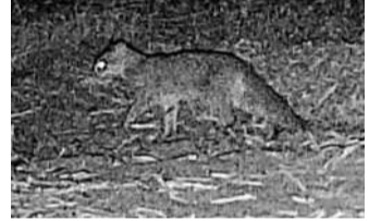
ప్రపంచంలోనే అతిచిన్న అడవి పిల్లి