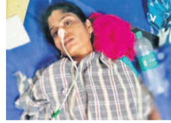
జమ్మికుంటలో విశిష్ట పాండుతున్న దళిత బంధు లబ్ధిదారు గాజుల అమల

విడత డబ్బులు రిలీజ్ చేయాలని వేడుకున్నాడు. విషయం తెలుసుకున్న హుజూరాబాద్ నియోజకవర్గ దళిత బంధు సంఘం నాయకులు అమలను పరామర్శించారు. డైరెక్ట్ చెప్పి భరోసా కల్పించారు.