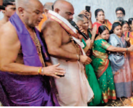
ఉత్తరగోల్లో ధన్యంతరి హోమంని ర్యపిస్తున్న వేద పండితులు

అయిజ, ఫిబ్రవరి 4: మండలంలోని ఉత్తరగోల్లో గోపాలదాసుల ఆరాధనోత్సవాల్లో భాగంగా వేద పండి