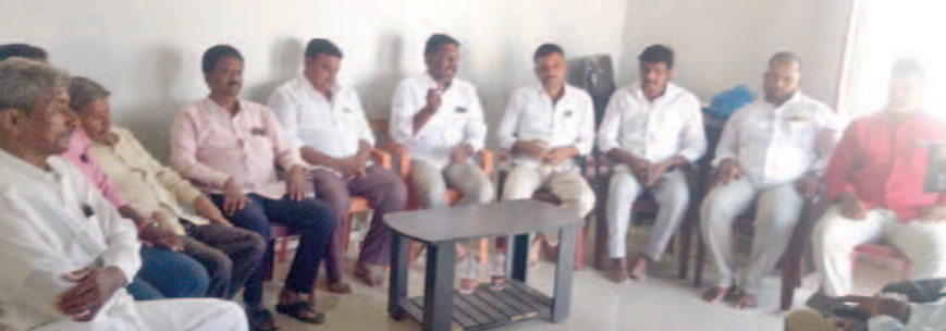
విలేజరుల సమావేశంలో మాట్లాడుతున్న వైసిపి ఎం పీ

బాలుర నిపుణ్ణితో పోలిస్తే బాలికల నిపుణ్ణితో తక్కువగా నమోదు అవుతున్నది. ఎప్పటికప్పుడు ఆయా దవాఖానా స్వామింగ్ నిలబడ్డ తనిఖీ చేయాల్సిన సలబందిత అధికారులు వైద్యులు, స్వామింగ్ సెంటర్ నిర్వాహకులు అందరినీ ముందుకు లతో ఆ వైపు చూసేటట్లు వ్యవహరిస్తున్నారని ఆరోపణలు వినిపిస్తున్నాయి. దీంతో విచ్చలవిడిగా లింగ నిర్ధారణ పరీక్షలు చేస్తున్నట్లు తెలిస్తోంది. జిల్లాలో గద్దాల, అయిజ, శాంతినగర్, అలంపూర్ ప్రాంతాల్లో దవాఖానాలో స్వామింగ్ పాలు గద్దాల, అయిజలో స్వామింగ్ నిలబడ్డ ఉన్నాయి. దవాఖానా, స్వామింగ్ సెంటర్ లింగ నిర్ధారణ చేయడం చట్ట విరుద్ధమని బోర్డులు ప్రధర్మిస్తున్నట్లు ఆచరణలో మార్చశూన్యం. సమగ్రమైన వ్యక్తులు నియమించుకొని పలువురు లింగ నిర్ధారణ పరీక్షలు యథేచ్ఛగా చేస్తున్నట్లు ఆరోపణలున్నాయి. ఇందుకు సామాన్యుల నుంచి వేలల్లో షీజులు వసూలు చేస్తున్నారు. దంపతుల అవసరాలను ఆసా చేసుకొని ఒక్కో కిసుకు రూ. 5 వేల నుంచి రూ. 10 వేల వరకు డిమాండ్ చేస్తున్నట్లు వినిపిస్తోంది. ప్రధానంగా తొలి కాసులో ఆడమిల్ల పుట్టి, రెండో సారి గర్భంలో బాలిన్ మహిళలు లింగ నిర్ధారణ వస్తున్నట్లు తెలుస్తోంది. 4, 5 నెలలకే స్వామింగ్ ఆడ లేదా.. మగ బిడ్డగా వివరాలు సైగగా ద్వారా వెల్లడిస్తున్నట్లు సమాచారం. జిల్లా కేంద్రంలో కొత్త బస్టాండ్ సమీపంలోని ఒక గోపాల