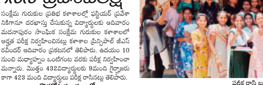
పరీక్ష రాసి బయటకు వస్తున్న విద్యార్థులు

కుల పాఠశాలలో నిర్వహించిన పరీక్షకు 212 మంది విద్యార్థులకు గానూ 205 మంది హాజరయ్యారని, 96.69 శాతం సమాధు అయ్యి డిప్యూటీ సీఎన్ పాఠశాలలోని సాంఘిక సంక్షేమ గురుకుల పాఠశాలలో ఉదయం