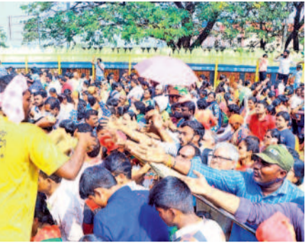
బంగారం కోసం పోటీపడుతున్న భక్తులు