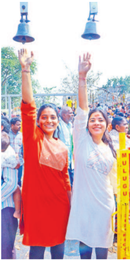
- తాడ్యాయి, ఫిబ్రవరి 4