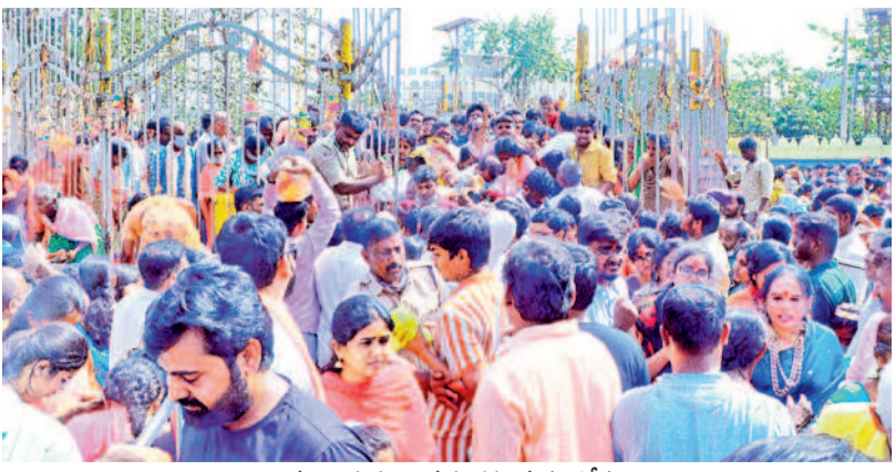
అమ్మవార్ల గడ్డల వద్ద భక్తజన సందోహం