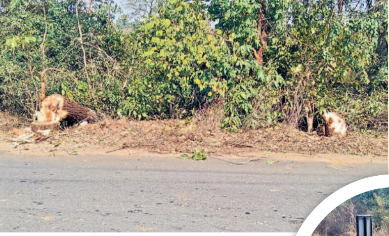
కమలాపూర్-రాంపూర్ మధ్య రోడ్డు వెంట నరికివేసిన చెట్లు

జయశంకర్ భూపాలపల్లి, ఫిబ్రవరి 4 (నమస్తే తెలంగాణ) : మేడారం దారిలో చెట్లు నేలకొరకుతున్నాయి. మొయింటెన్స్ లో భాగంగా చేస్తున్న జంగిల్ కటింగ్ పేరుతో భారీ వృక్షాలను నరికేస్తున్నారు. మేడారం సమృద్ధి, సారలమ్మ మహాజాతర సమీపి స్పందనతో జిల్లాలోని భూపాలపల్లి మండలం కమలాపూర్ రోడ్డు, కాటారం రోడ్డు పాడవుతూ మేడారం వరకు రోడ్డుకు ఇరువైపులా ఆర్ అండ్ బీ అధికారులు జంగిల్ కటింగ్, సైడిబర్ని, మొయింటెన్స్ పనులను ప్రారంభించారు. మొత్తం 75 కిలోమీటర్ల పాడవుతూ రూ. 15 లక్షలతో చేపట్టిన ఈ పనుల్లో చెట్లను తొలగిస్తున్నారు. కాటారం రోడ్డు పాడవుతూ మేడారం వరకు 50 కిలోమీటర్ల, భూపాలపల్లి మండలం కమలాపూర్ రోడ్డు పాడవుతూ 25 కిలోమీటర్ల జంగిల్ కటింగ్ పనులు కొనసాగుతున్నాయి. రోడ్డుకు ఇరువైపులా చదును వృక్షానికి అటవీశాఖ అధికారులు చట్టించుకో పోయడం, వాహనాలకు అడ్డు వచ్చే చెట్ల కొమ్మలను కట్టే చేయిస్తున్నారు. అయితే చెట్లను మాత్రం తొలగించొద్దు. కానీ మండలంలోని కమలాపూర్, రాంపూర్ గ్రామాల మధ్య జంగిల్ కటింగ్ భాగంగా యెట్ల చూగ చెట్లను నరికేస్తున్నారు. ఈ రోడ్డు