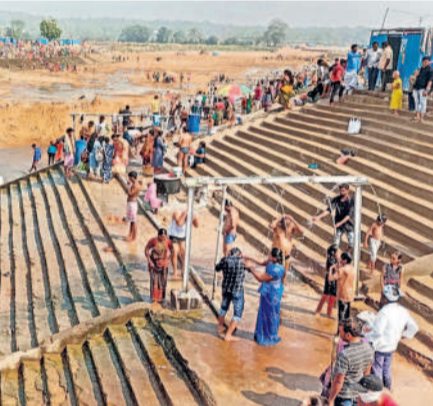
జంపన వాగులో స్నానాలలోనిస్తున్న భక్తులు