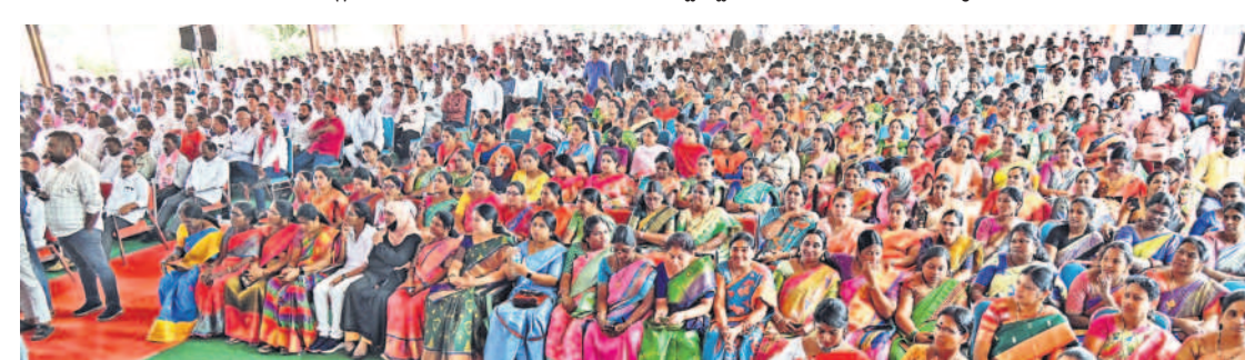
ఉప్పల్ సమావేశానికి హాజరైన బీఆర్ఎస్ శ్రేణులు

మేధ్యల్, ఫిబ్రవరి 4 (నమస్తే తెలంగాణ): 'ఇచ్చిన హామీలు ఎగ్జిట్ ప్రయత్నం చేస్తున్న సీఎం రేపంతో.. మహాలక్ష్మి పడకం కోసం ఆడబిడ్డలు కండ్లలో పక్కలు వేసుకుని బదులు చూస్తున్నారు.. కేసీఆర్ పై తిట్ల పురాణం బంద్ చేసి.. ముందు ప్రజలకు ఇచ్చిన మాట నిలబెట్టుకో' అని బీఆర్ఎస్ వర్కింగ్ ప్రెసిడెంట్ కేటీఆర్ అన్నారు. ఆదివారం మేధ్యల్-మల్కాజిగిరి పార్లమెంట్ పరిధిలోని ఉప్పల్, మల్కాజిగిరి నియోజకవర్గాల విజయోత్సవ సమావేశాల్లో కేటీఆర్ పాల్గొని మాట్లాడారు. వచ్చే పార్లమెంట్ ఎన్నికల్లో కేంద్రంలో కాంగ్రెస్ ప్రభుత్వం అధికారంలోకి వస్తేనే ఇచ్చిన హామీలను అమలు చేస్తామని సీఎం రేపంతో సిగ్గుచాటిన మాటలు మాట్లాడుతున్నారని, అసెంబ్లీ ఎన్నికలకు ముందు ఈ మాట ఎందుకు అనలేదని కేటీఆర్ ప్రశ్నించారు. వంద రోజులు ఓపికగా ఉంటామని.. మార్చి 17 తర్వాత ఆరు గ్యాంగుంటేలు అమలు కాకపోతే ప్రజల పక్షాన గ్యాంగుంటేలు సంస్థలను మేధ్యల్ ప్రజలు ఆలోచించి, అభివృద్ధి కోసం ఓటు వేశారు. జిల్లాలు, గ్రామాల్లో ప్రజలు కాంగ్రెస్ పార్టీ ఇచ్చిన 420 హామీలను సమీక్షా సమావేశాల్లో అని అన్నారు. కరెంటు బిల్లులు కట్టడవరూ..? 'కాంగ్రెస్ పార్టీ అధికారంలోకి రాక ముందు ప్రజలకు కరెంటు బిల్లులు కట్టడవరూ అన్నారు.