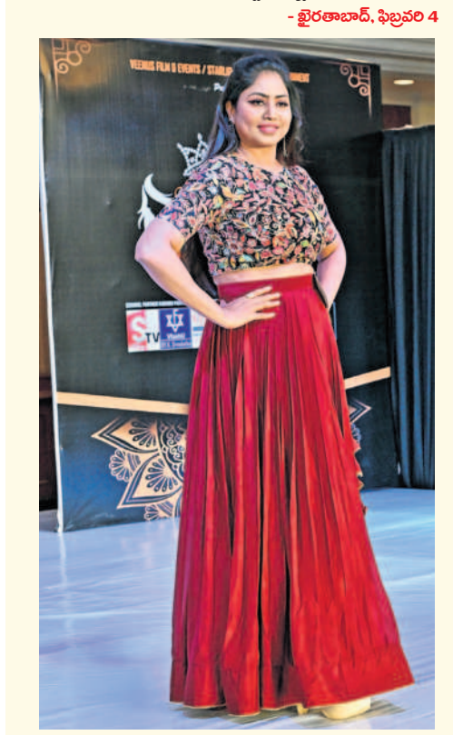
- బిర్రాబాద్, ఫిబ్రవరి 4

మిసెస్ అండ్ మిస్ మెరుపులు అందమైన బావలు ర్యాంప్ వాక్ చేస్తూ హోయలు పోయారు. ఆదివారం రాత్రి వీసెస్ ఫిట్స్ అండ్ ఈవెంట్స్, స్టార్ లైట్ ఈవెంట్ అండ్ ఎంటర్టైన్మెంట్ అధ్యక్షులతో సామాజిగూడలోని కల్పితా హోటల్లో మిస్, మిసెస్ సౌత్ ఇండియా ఫ్యాషన్ పోటీలను నిర్వహించారు. ఈ సందర్భంగా పలువురు మోడల్స్ ర్యాంప్ వాక్ చేసి ఆకట్టుకున్నారు.