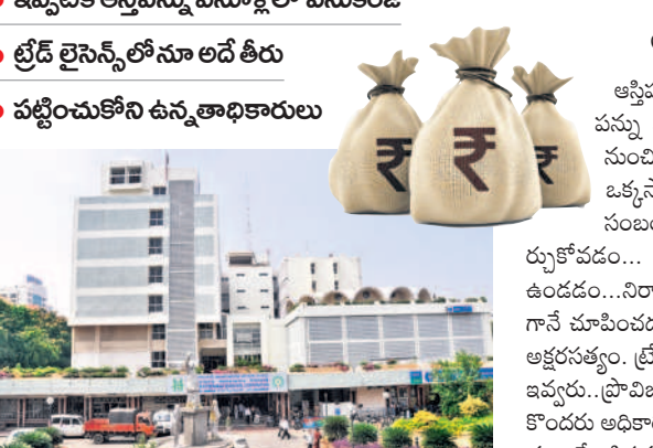
లైసెన్స్ లను పునరుద్ధరిస్తే రెన్యూవల్ దరఖాస్తులపై అదనంగా 50 శాతం అవరూద రుసుముగా వసూలు చేస్తారు.

లైసెన్స్ లను పునరుద్ధరిస్తే రెన్యూవల్ దరఖాస్తులపై అదనంగా 50 శాతం అవరూద రుసుముగా వసూలు చేస్తారు. ట్రేడ్ లైసెన్స్ పొందకుండా వ్యాపారాలు నిర్వహిస్తే 100 శాతం పినాల్టీ విధించడంతో పాటు నెలకు 10 శాతం అదనపు జరిమానా విధిస్తారు. అదనపు అంతస్తులు ఉండే.. ఆస్తిపన్ను వసూళ్లలో అక్షమాలును పరిశీలిస్తే.. ఆస్తి పన్ను ఏరియా తక్కువ చూపించడం.. కమర్షియల్ నుంచి రెసిడెన్షియల్ చూపించడం, వేయాలైన ట్యాక్స్ ఒక్కసారి వేసి భయభ్రాంతులకు గురిచేసి ఆ తర్వాత సంబంధిత భవన యజమానితో ఒప్పందాలు కుదుర్చుకోవడం.. నిర్మాణంలో ఒక్క దుకాణం ఉన్న.. రెసిడెన్షియల్ గానే చూపించడం వంటివి అక్షమాలు జరుగుతున్నాయన్నది అక్షరసత్యం. ట్రేడ్ లైసెన్స్ పాత ట్రేడ్ ఇండెక్స్ నంబరు. ఈజిల్ ఇవ్వరు.. ప్రావిజన్ విధానంలో కొనసాగిస్తూ వ్యాపారస్తులతో కొందరు అధికారులు అందినంత దండంకొంటున్నారు. దీని ఫలితంగానే ఆస్తిపన్ను ట్రేడ్ లైసెన్స్ నుంచి రావాల్సిన అదాయం సంస్థకు రావడం లేదు. ముందుకు సాగని ఆస్తిపన్ను వసూళ్లు ఆస్తిపన్ను చెల్లింపులో ఈ ఏడాది నిర్దేశిత లక్ష్యాన్ని అధిగమించడం కష్టమేనని అధికార వర్గాల్లో చర్చ జరుగుతున్నది. కమిషనర్ ఆడి శించినా.. క్షేత్రస్థాయిలో మాత్రం ఆస్తిపన్ను వసూళ్లు ఆగిపోయిన స్థాయిలో రావడం లేదు. గత నెల 31వ తేదీ మాత్రం ఒక్కరోజు రికార్డు స్థాయిలో రూ. 28కోట్ల మేర అదాయం వచ్చింది. ఈ నేపథ్యంలోనే రూ. 2100కోట్ల టార్గెట్లో ఇప్పటి వరకు రూ. 1333 కోట్లు మాత్రమే ఆస్తిపన్నును రాబట్టారు. ట్రేడ్ లైసెన్స్ పునరుద్ధరణకు.. గ్రేటర్ హైదరాబాద్ పరిధిలో ట్రేడ్ లైసెన్స్ పునరుద్ధరణకు అవకాశం కల్పించినట్లు జీహెచ్ఎంసీ కమిషనర్ రోనాల్డ్ రాన్ ఒక ప్రకటనలో