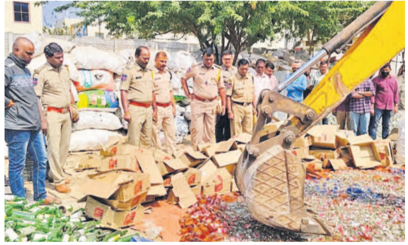
నకిలీ లిక్కర్లను ధ్వంసం చేస్తున్న ఎక్స్లెజ్ అధికారులు